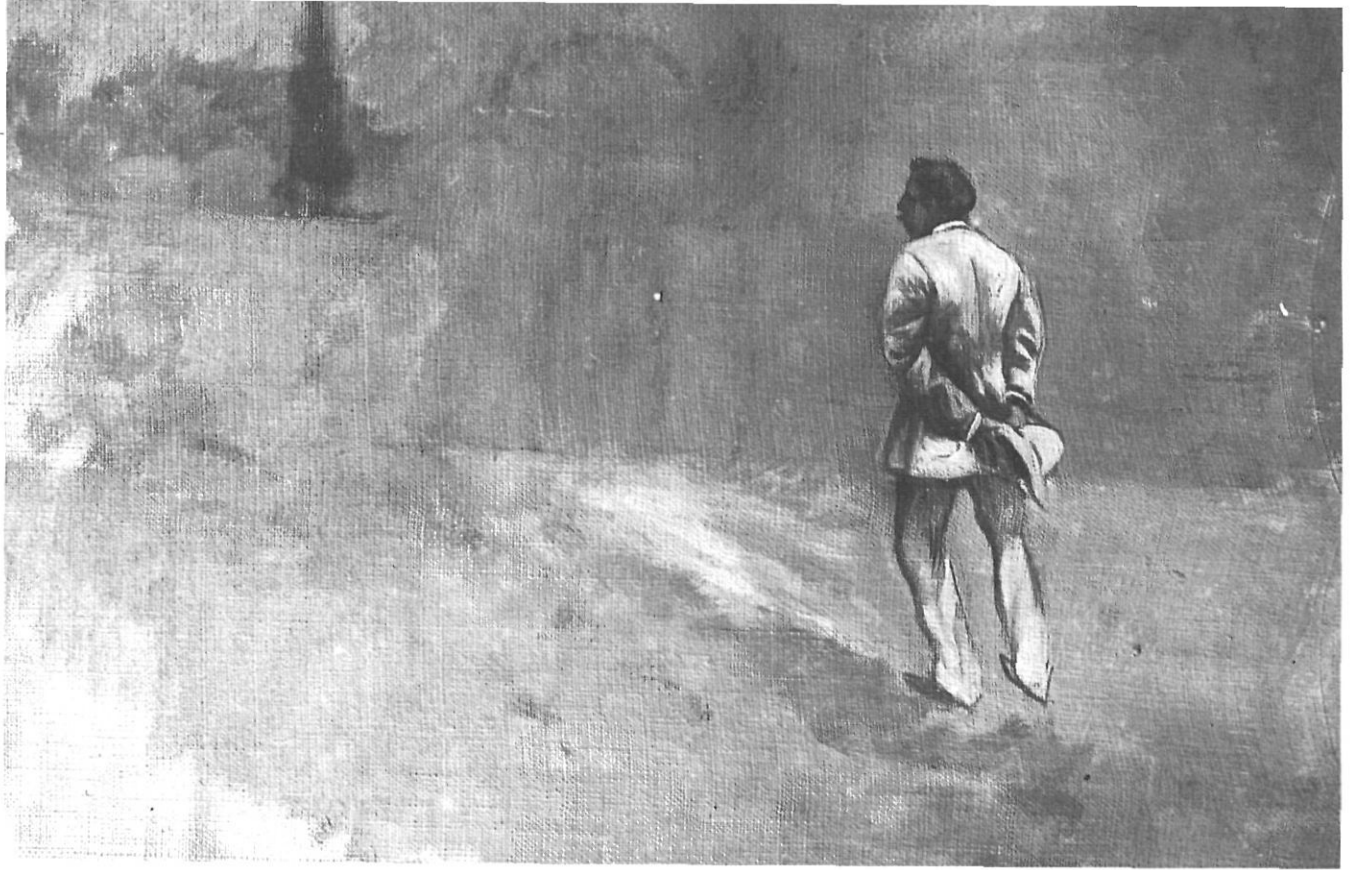
"Estudi en gris", de Prudenci Bertrana, il·lustració perfecta per al personatge de Somerset Maugham i per a l'hermetisme gironí.

hagués sentit, però quan ja eren de tornada, en passar pel mateix indret, va deixar anar amb tota naturalitat: "Per màrfegues".