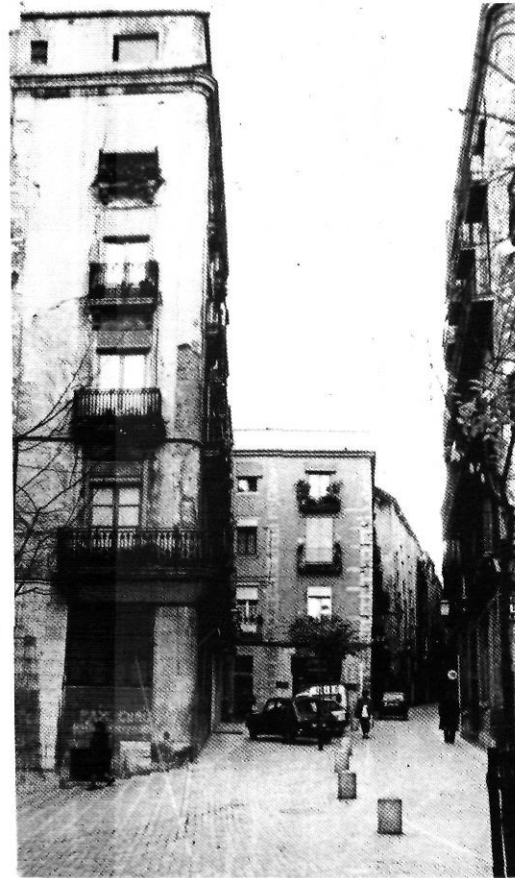
Carrer de la Força: culminació de les obres.

Ara, finalment, és el carrer de la Força el que celebra amb actes culturals i festius la culminació de les obres de rehabilitació. Aquests esclats, encara massa esporàdics, no són sinó els pròlegs il·lusionats i espontanis d’un programa pendent. Europa és plena d’exemples del que es pot fer i s’ha de fer per animar el centre històric. La iniciativa dels veïns hi té molt a dir —i hi diu— però la intervenció institucional hi és indispensable, més enllà de la pura actuació urbanística. Allà on s’han produït canvis notables i renovacions espectaculars, ha estat per la conjunció eficaç de l’esforç privat i de l’aportació pública. I aquí, els uns pels altres, anem passant els anys i desaprofitant les experiències aïllades sense integrar-les decididament en un pla d’actuació global.