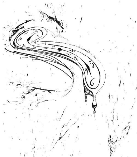
L'hora de Dalí és l'hora del futur?

El mateix dia que publicava aquestes afirmacions, el diari recollia discretament un altre fet; en un tres i no res, i a les mateixes barbes de la policia urbana, un desconegut havia fet desaparèixer el rellotge que presidia el vestíbul de la Casa Consistorial de Figueres. Amb una inesperada coherència, la notícia de la darrera pàgina venia a il·lustrar la tesi de l'article de fons: si l'Ajuntament havia perdut el rellotge, malament trobaria el futur. Perquè els famosos rellotges tous de Dalí tenen les broques completament aturades.