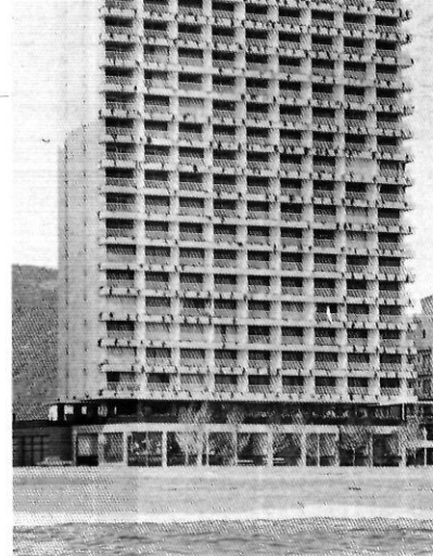
Platja d'Aro, la depredació que ningú no va aturar.

Si algú hagués alçat la veu fa trenta anys, potser ara no ens caldria el Consorci de la Costa Brava. El Consorci que, paradoxalment, ens diu allò que nosaltres no vam saber dir a temps.