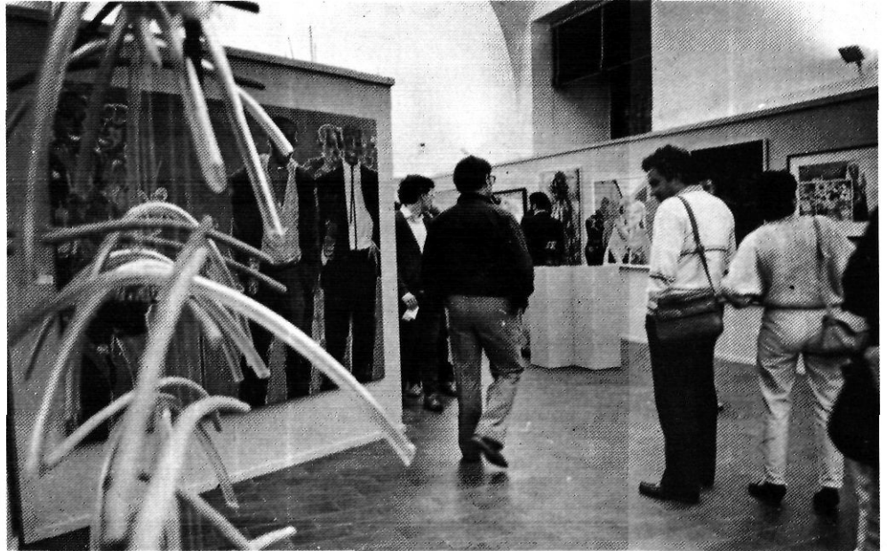
Aspecte de la Mostra, a la Casa de Cultura de Girona.

L'exposició, oberta a Girona amb motiu de les Fires de Sant Narcís i que posteriorment serà presentada a Tarragona i a Lleida, oferia una panoràmica espectacular i significativa de la línia més avançada de l'art gironí d'avui i assolia, per tant, un èxit remarcable. Aquesta realitat enlluernadora no pot amagar, però, algunes limitacions de l'experiència. A l'escrit de presentació del catàleg de la Mostra, el propi president de la Diputació expressa els seus dubtes sobre «si les bases, els sistemes de selecció, la fórmula d'exhibir les obres presentades i, fins i tot, d'adquirir-ne unes quantes per formar part del fons del nostre Museu d'Art, han estat les més encertades». La Corporació s'ha declarat atenta a nous suggeriments i, gràcies a aquesta actitud oberta i receptiva, podem començar a fer-los modestament des d'aquí mateix.