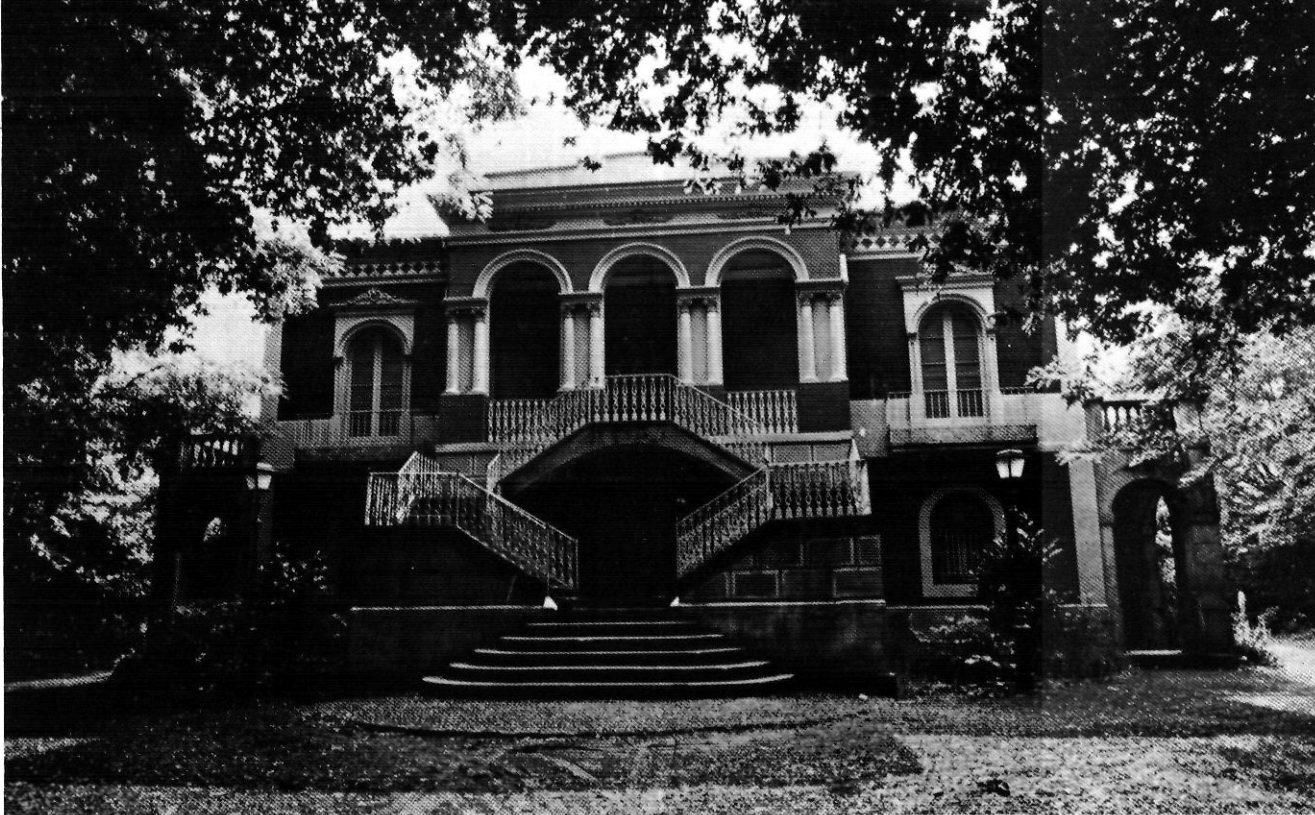
La Torre Castany del Parc Nou.

amb la seva mà hi ha produït. Des d'uns tipus de conreus i oficis artesanals (carboners, artigaires, culleraires) lligats a la terra, passant per unes determinades concepcions artístiques i intel·lectuals i arribant fins i tot a la implantació de determinades indústries, el paisatge ha estat un element clau. Es mostrarà la diferent visió i interpretació que l'home ha tingut de la natura, des de la perspectiva contemporània de cada època.