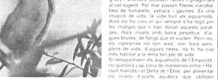
LA VIDA HI BULL. Als capvespres de la primavera i la tardor, vola de milers d'anades i hiberna amb els estans prop de Palaü. Aquest gran salt en debat i en portarà un bon nombre a la mort. No podem permetre que es destrueixi ni aquest ni cap altre maresme del nostre país. És possible que algun pensu quina importància té la vida d'uns ocells. Amb els arrencaments de vida al nostre planeta.

Sobre aquests estanys també pesa l'amenaça de la dessecació per urbanitzar-los i construir-hi un port esportiu. En el Ter s'hi troba l'única colònia de penyes arribades de Catalunya; hi ha uns 40 parelles de martinet de nit ( Nycticorax nycticorax ). 8 de martinet blanc ( Egretta garzetta ) i 2 de espliuoluc ( Hydrochelidon ). Aquesta colònia serà destruïda si continua la canalització del Ter.