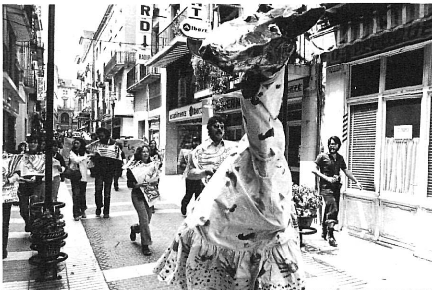
22 de maig de 1977: manifestació a Figueres.

- Febrer 1980. Creació de la IAEDEN (Institució Altempordanesa per a la