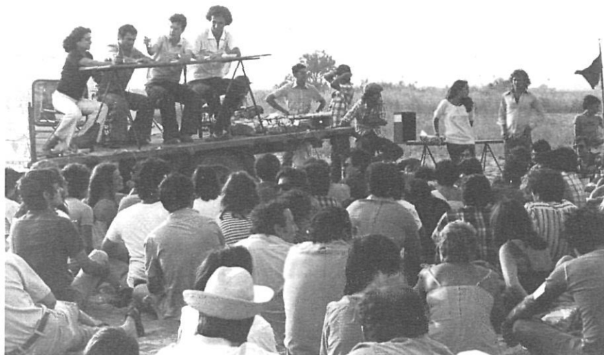
20 d'agost de 1978: concentració a la platja de Can Comas.

"Tal com ha anat l'aprovació de la llei, hem de dir amb tristesa i desànim que, encara que només sigui de manera testimonial i per a informació dels ciutadans que no viuen ni de la política ni de l'especulació, el Centre d'Estudis del Baix Empordà Pere Cinquè aguantarà els plantejaments inicials i farà memòria del contingut de la llei del Sòl sobre el tema. Aquesta llei és l'única que, en aquests moments, dóna una protecció per aquests paratges naturals, encara que sovint es manipuli i s'incompleixi".