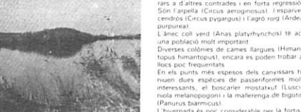
Estany Massons, prop de la desembocadura del Fluvià. Al fons antics recadors d'arros.

Aquestes zones haurien d'ésser protegides amb la constitució d'amples reserves. Es poden al·legar alguns altres objectius: 1) Els aiguamolls regulen el cabal dels rius, mantenen la humitat de l'atmosfera i el nivell de les aigües subterranies.