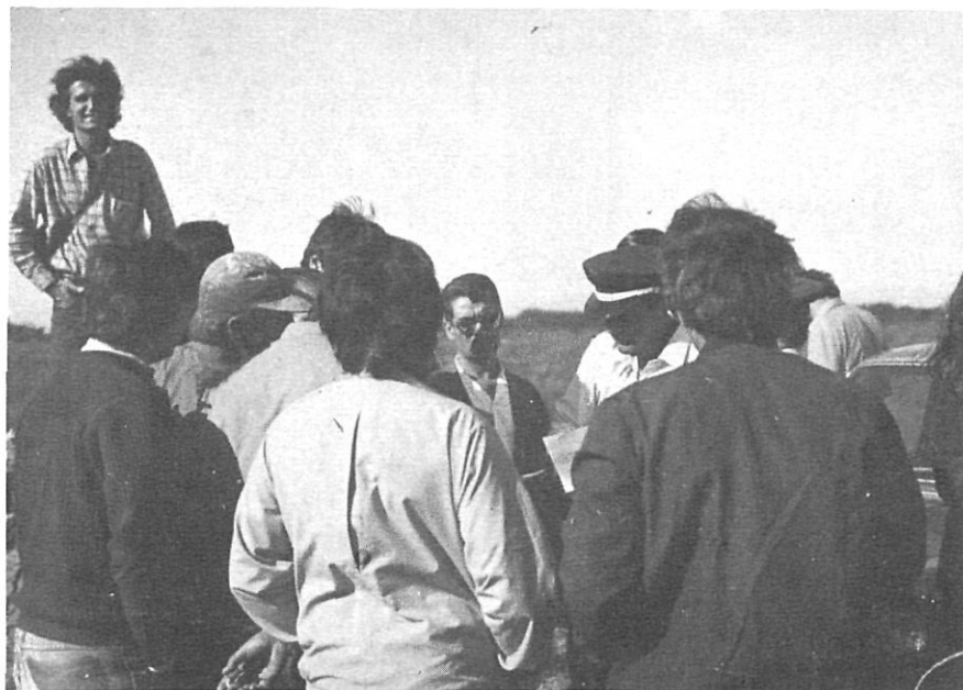
El 28 de setembre de 1981 es paralitzen les obres de Port Llevant per ordre de l'alcaldia de Castelló d'Empúries.

L'any 1976 apareix a la premsa un manifest signat per quatre personalitats catalanes. L'any 1982 es publica aquest altre manifest massiu.