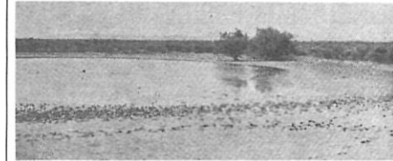
Estany prop de la Muga. A l'estiu, en baixar el nivell de l'aigua, apareix en les vores fangoses que proporcionen aliment a molts ocells.

Antigament, gran part de la zona terrestre de la Badia de Roses i del baix Ter era ocupada per immenses maresmes, comparables en importància al que ara és el Delta de l'Ebre, l'Albufera de València o les Tables de Dalmiel.