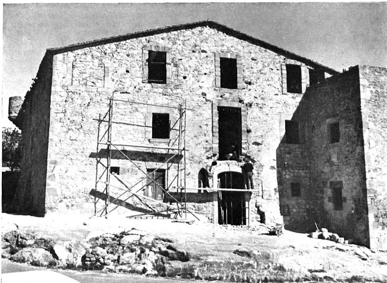
Casa Pruna en el començament de les obres de restauració.

Casa de Cultura en la que es convertiria l'antic edifici de «Casa Pruna», situat a l'exterior del recinte emmurallat. Li vam prometre que malgrat haver-ne parlat en aquesta revista molts d'altres, indiscutiblement força millor que ho podem fer nosaltres, del bell Padró, anys enllà rònec i tètric i enguany un dels millors conjunts arquitectònics que destaquen a la rodalia, escriuríem sobre Pals i la seva futura Casa de Cultura. Encara no havíem complert la nostra promesa quan vam rebre la trista notícia de la mort d'aquell home, senzill i emprenedor, que sentia l'orgull ben entès de la prosperitat del seu poble. Fou aleshores que vam prendre el determini de no deixar passar cap més dia sense complir la paraula que li donarem aquell vespre en el Padró. Malgrat no puguí llegir amb els seus ulls terrenals les nostres línies mal engiponades, volem destacar avui la tasca lloable a la qual va dedicar gran part de les seves hores, sense atemorir-se davant les dificultats, per oferir als seus habitants i a tots aquells que visiten la vila, un poble transformat, però sense perdre la seva fesomia pròpia.