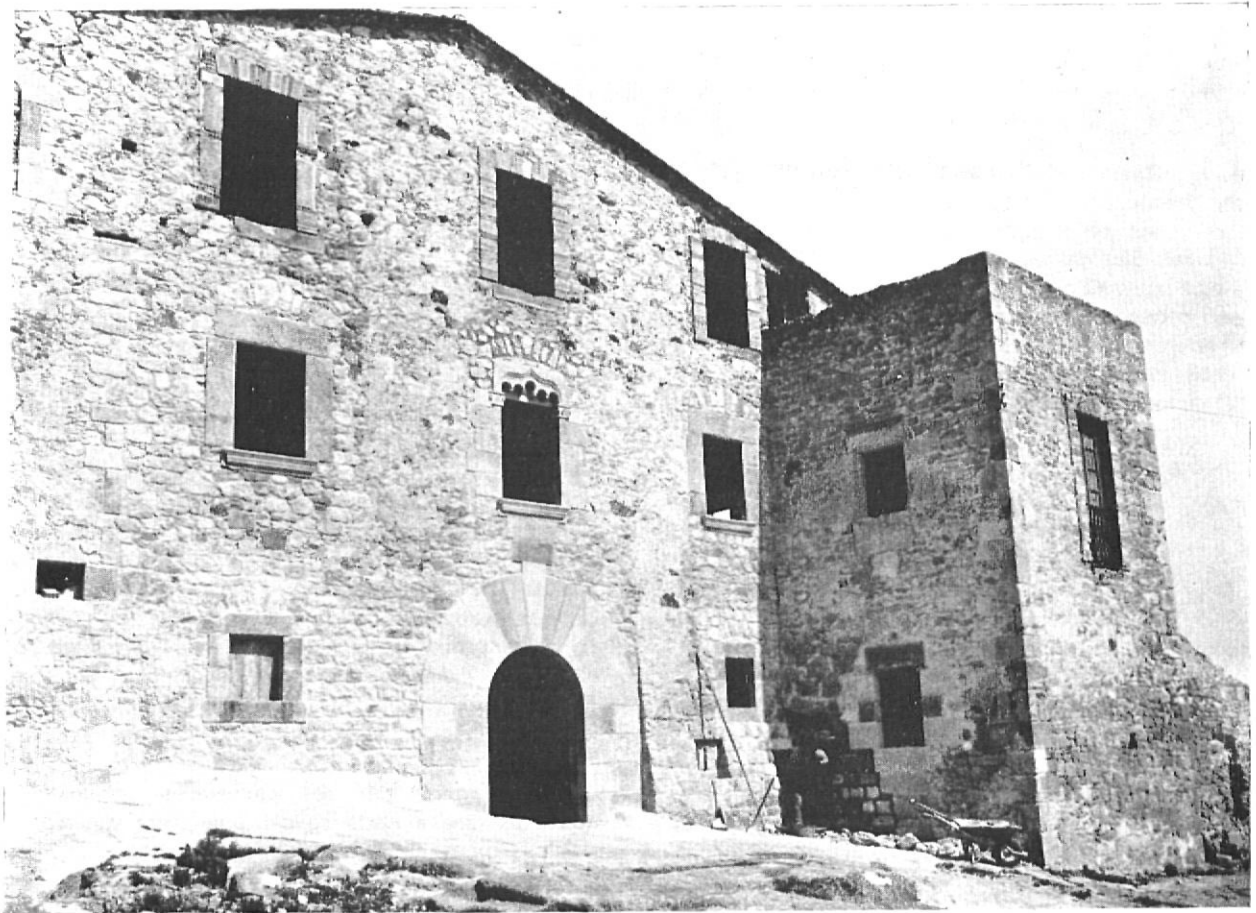
Les obres avancen en ascendent procés de transformació.