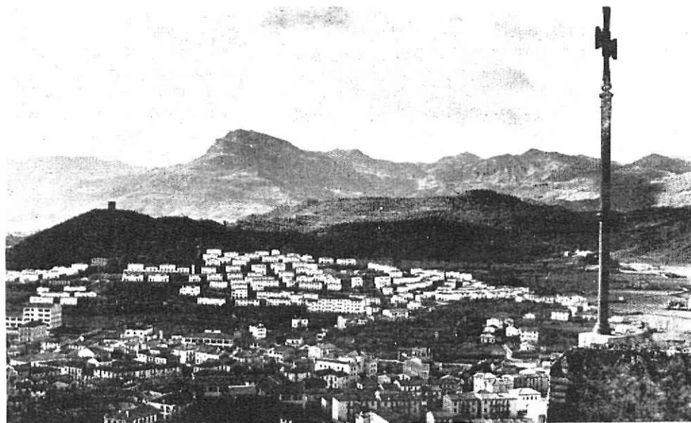
Vista de Olot