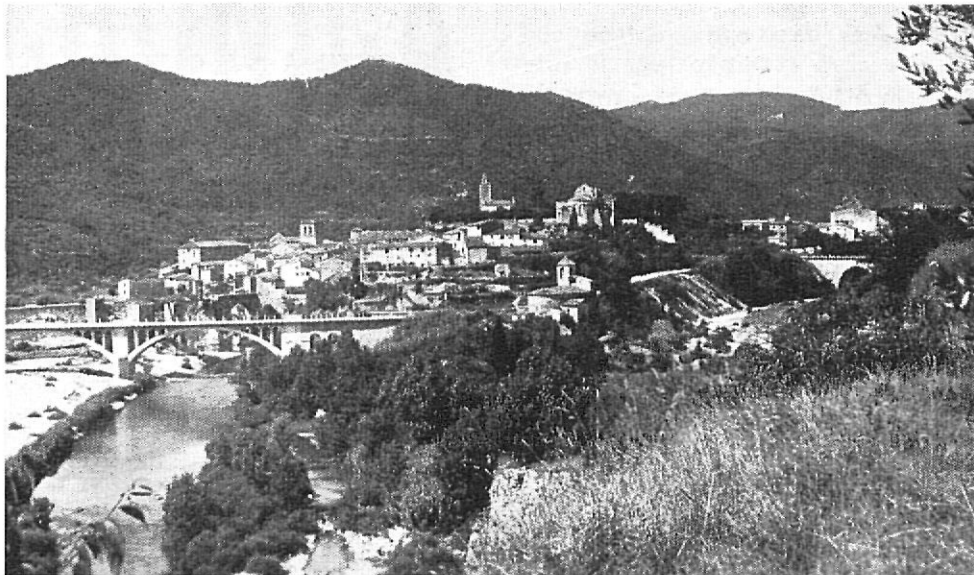
BESALU. — Vista general

En esta época tuvo efecto la presentación de una selecta exposición del famoso pintor gerundense Isidro Vicens, en la Sala «Francisco Armengol». La obra de Vicens fue profundamente admirada por todos los entendidos y artistas, destacando por su alta categoría estética y su personal estilo que constituyó una admirable sorpresa y, por que no decirlo, un verdadero maestrazgo pictórico. Dicha exposición fue visitadísima.