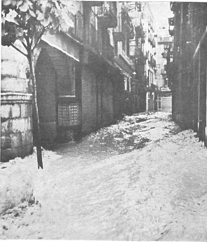
Aspecto de la calle de Calvo Sotelo de la capital de la provincia. Los perjuicios causados al comercio gerundenses fueron cuantiosísimos.

Asimismo el Subdirector General visitó la provincia y estudió en Figueras el encauzamiento de la Riera Galligans.