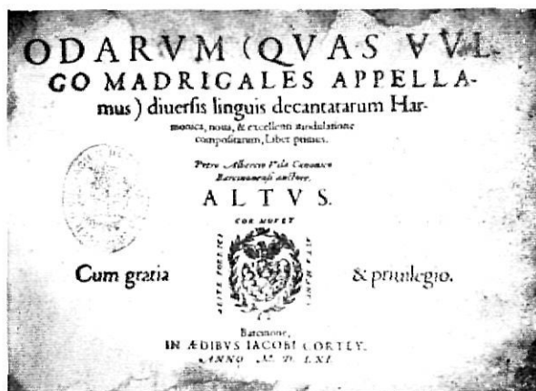
Ejemplar único de los Madrigales de Pere Albert Vila, obra de inapreciable valor bibliográfico, impresa en Barcelona en 1561

Este importante fondo musical, más el legado por Pedrell antes de morir, constituyeron la base