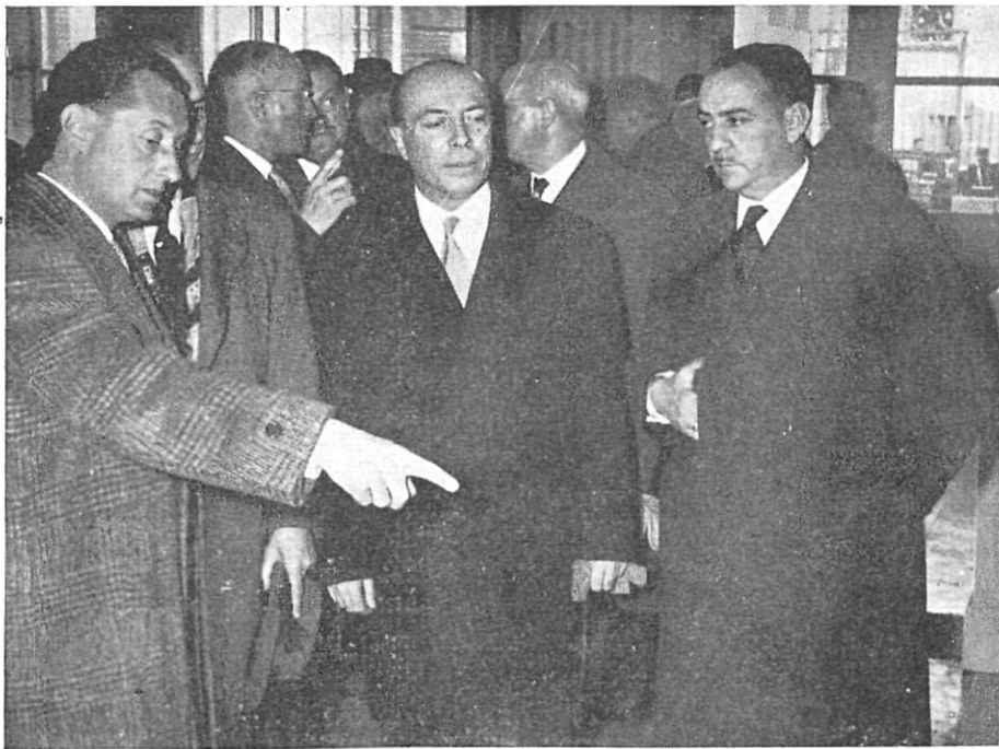
Las autoridades provinciales en la solemne inauguración de la exposición de Perpiñán

Como justa réplica a la exposición de Obras Maestras de la Pintura Francesa celebrada en