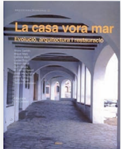
DIVERSOS AUTORS La casa vora mar Evolució, arquitectura i tradició Brau Edicions. Figueres, 2012.

La voluntat del llibre és oferir un estudi de referència sobre les cases del litoral en general —i molt especialment sobre els habitatges dels pescadors— que sens dubte esdevindrà de consulta obligada. Són especialment interessants les aportacions planimètriques que ofereixen una taxonomia de barris i cases de pescadors. Es tracta d'arquitectura