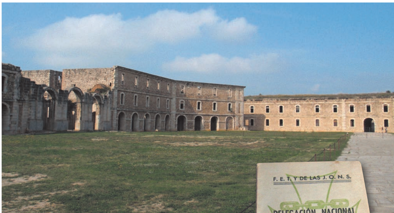
>> Castell de Sant Ferran de Figueres.