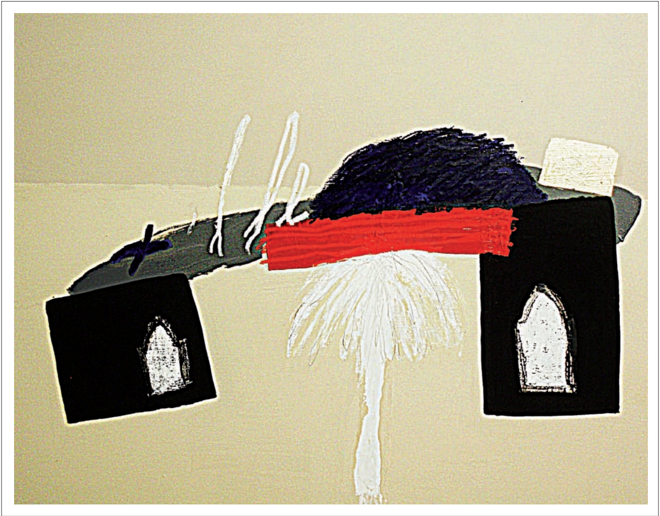
Després del viatge a Tunísia. 2010. Acrílic sobre tela. 80 x 100 cm.

a l'hostal de Garriguella, m'ha servit per saber amb més detall quin és el seu proper projecte: una exposició a Sant Quirze de Colera, a la primavera, de només dos dies, amb obra de grans dimensions produïda expressament per a l'ocasió, on podrà explorar les sensacions que des de sempre li han provocat tant l'Albera com el romànic estrepitós de Sant Quirze.