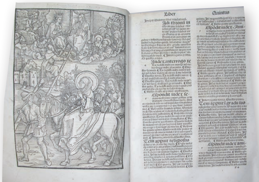
>> Revelaciones Sanctae Birgittae, 1500.