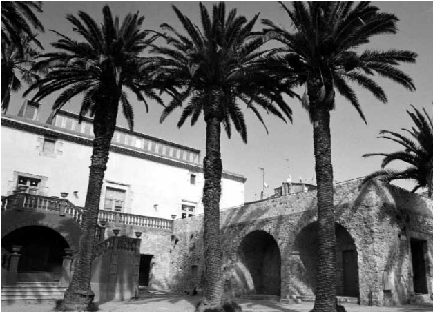
La casa pairal dels Quintana.

vera llibertat. La llibertat de pensar, el respecte a totes les idees i a totes les crencies, la tolerància perfecta, són la conseqüència natural i lògica de la llibertat dels homes, aixís com el fanatisme i la intransigència són fills legítims de l'absolutisme [...]. I els que no volen la llibertat igualment per a tots, els que no practiquen la perfecta tolerància, els qui volen imposar per la força llurs idees i no respecten la llibertat dels altres són sempre absolutistes, dèspotes, fanàtics [...].(30) Si La Crònica va ser el mitjà del catalanisme progressista de Vergés i Barris, Baix-Empordà , fundat per Miquel i Avellí l'any 1909, representava, en canvi, el catalanisme conservador de La Lliga. A diferència del setmanari de Vergés, de vida molt efímera, Baix Empordà , vertader portaveu de la patronal surera, va perdurar fins a l'esclat de la Guerra Civil.