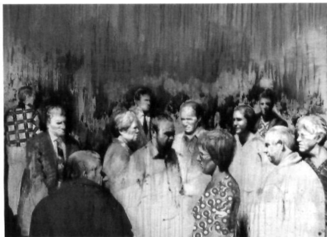
Papers , de Joan Mateu (2006). Acrílic sobre tela.

Aquest any hem pogut contemplar la quarta edició de la Biennial d'Art de Girona. La Diputació, a través de la Fundació Casa de Cultura, ha refermat el seu compromís vers les noves arts plàstiques. La mostra, com s'ha palesat, ha sabut representar bona part del millor art de les contrades, del millor art contempora-