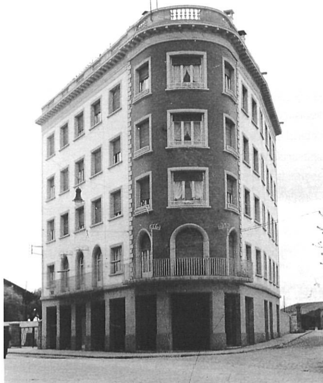
Casa Reig. Ricard Giralt. c/ Bailèn - c/ Barcelona.