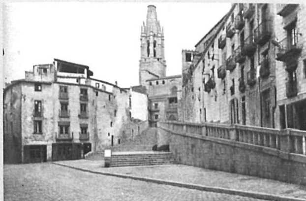
Pujada de Sant Feliu de Girona. 1927. Publicada a Arquitectura i Urbanisme , abril de 1934.