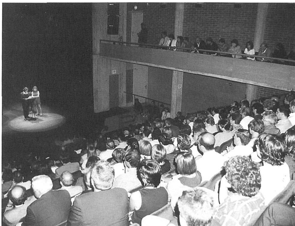
La sala del Teatre de Salt, amb un aforament de més de tres-centes persones

Es tracta no tant de cohesionar el municipi de Salt, com de situar-lo en el mapa cultural de Catalunya. Per a un poble que ha palpat en la seva pell l'experiència amarga de comprovar com no n'hi ha prou amb recuperar les seves institucions municipals per evitar el perill de perdre cohesió i pes específic, aquest teatre pot ser també el començament d'una segona oportunitat. Perquè ara, després d'aquests darrers vint anys de suburbialització de ciutat dormitori, la gent de Salt sap molt bé que són els trets específics i els accents propis allò que permeten que un poble pugui continuar essent encara un poble. Per això, tal com apunta Salvador Sunyer, més que no pas ignorar el veïnatge de Girona, el que convé és complementar, trobar en aquest món cada vegada més interrelacionat i dependent la possibilitat de tenir uns trets característics. «Entre el Teatre Municipal i La Planeta, aquest nou teatre ha d'apostar per les obres de les companyies que busquen locals de format mitjà, també per les que fan obres