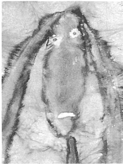
“Femme bleue à la bouche triste”. Aquarel·la 36,5x26.