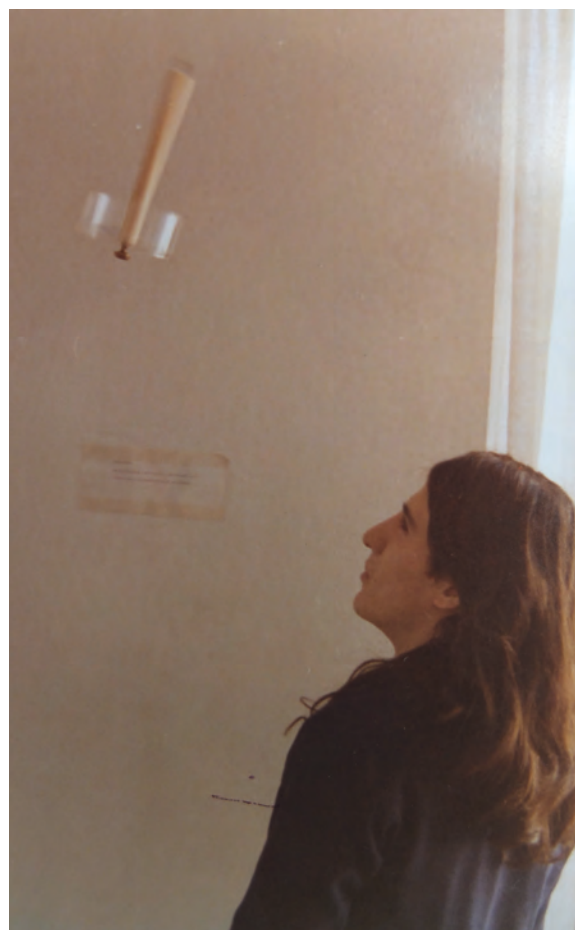
>> Girador, exposició a l'Espai 10 de la Fundació Joan Miró, Barcelona, 1979.