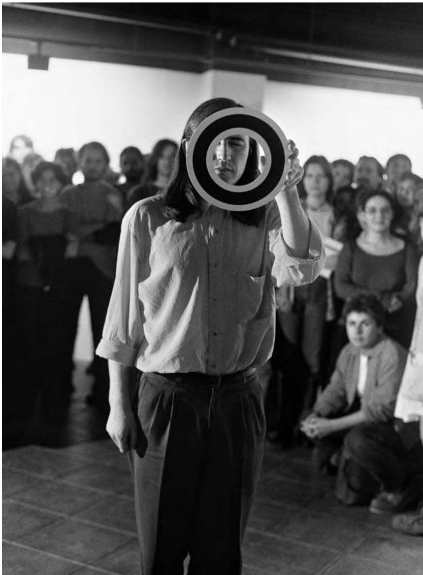
>> Acció concentració 2, 1995.

Londres va presentar una petita mostra sobre documents de les seves intervencions. Per inaugurar l'exposició, va dur a terme l'acció The Power Project , intervenint la façana d'un edifici.