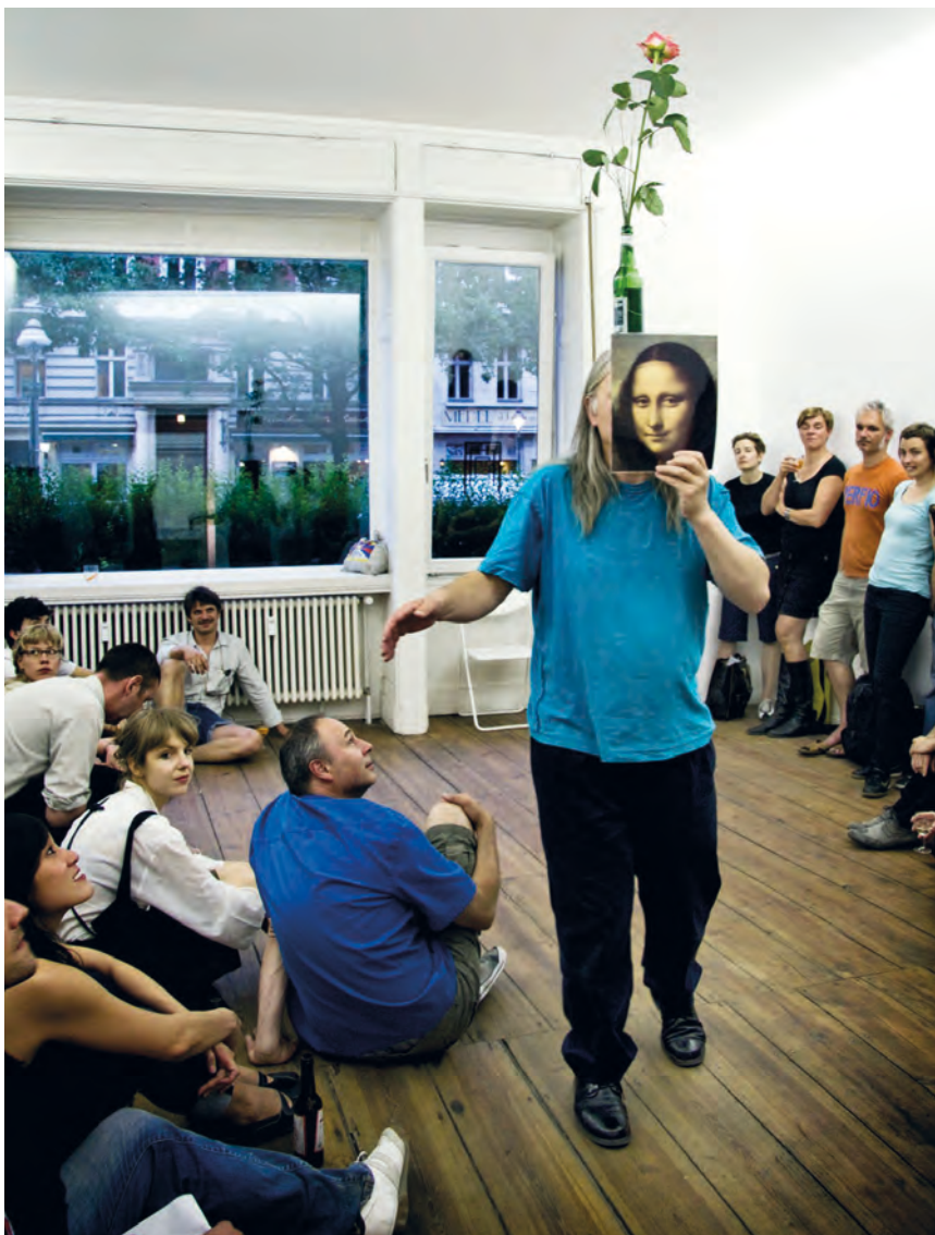
>> Kopaction, Grimm Museum, Berlín, 2011.

ther Ferrer, Bartolomé Ferrando, Nieves Correa, Denys Blacker i Concha Jerez, entre d'altres. Un magnífic recull de cartells que avui dia forma part del fons del Museu de l'Empordà.