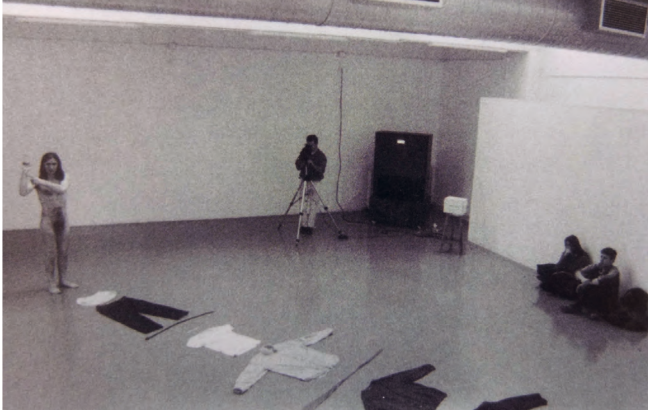
>> Acció relació, Belles Arts, Barcelona, 1997 .

'frontera', i el salt d'aigua de la Caula, del llatí 'càlida'.