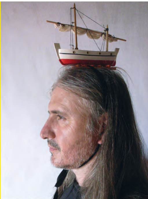
>> Acció marina (foto, 2008; pintura, 2016).