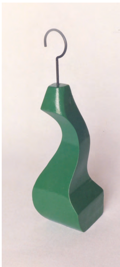
>> Objecte verd, 1979.

A Nova York s'hi va estar cinc anys, exposant escultures de gran format, pintura i fotografia en espais com la Bridgewater Lutzberg Gallery, però també a la Sala 491 de Barcelona, la Fundació Espais de Girona i la Drie 05 Gallery d'Amsterdam. Sense diners i