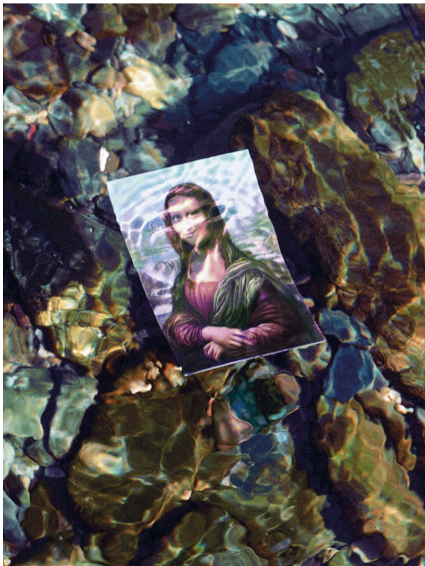
>> La Gioconda de Cadaqués, foto-acció, 2004.