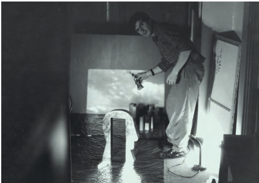
>> La porta de NY, maqueta, 1988.