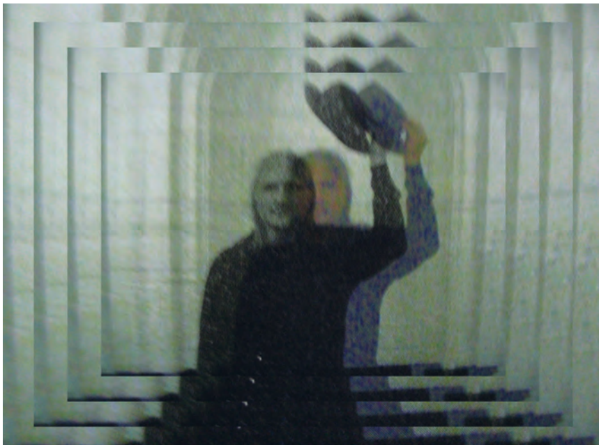
>> Acció de saludar lentament, obra gràfica. Festival Deformes, Santiago de Xile, 2006.