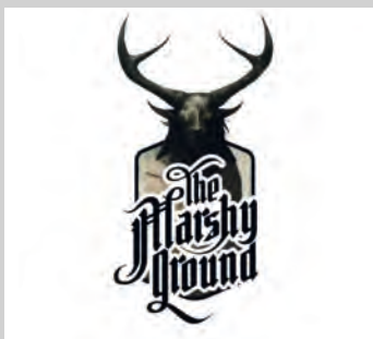
THE MARSHY GROUND. The Marshy Ground . The Marshy Ground, 2023. < https://www.instagram.com/themarshyground >

Eternitat es publica en format digital i en una edició limitada de cent exemplars en vinil.