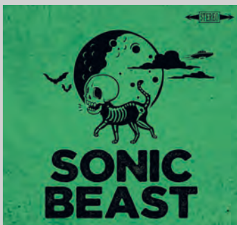
SONIC BEAST. Accidental . BCore Disc, 2023. < https://www.instagram.com/sonicbeastrocks >