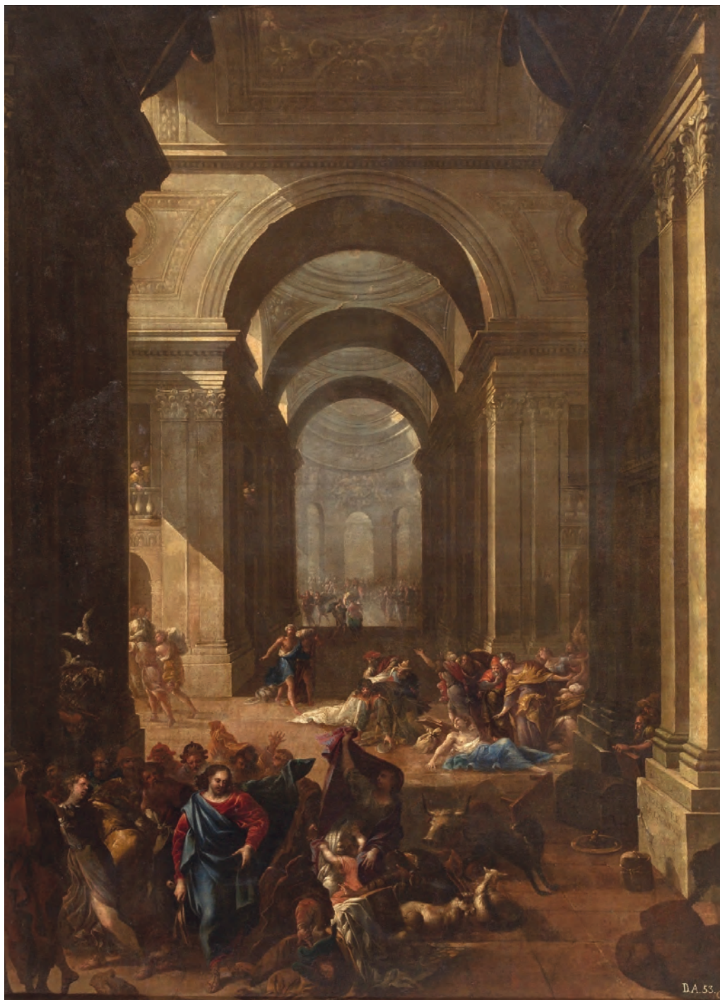
>> Expulsió dels mercaders del temple, oli sobre tela de Vicent Salvador Gómez.