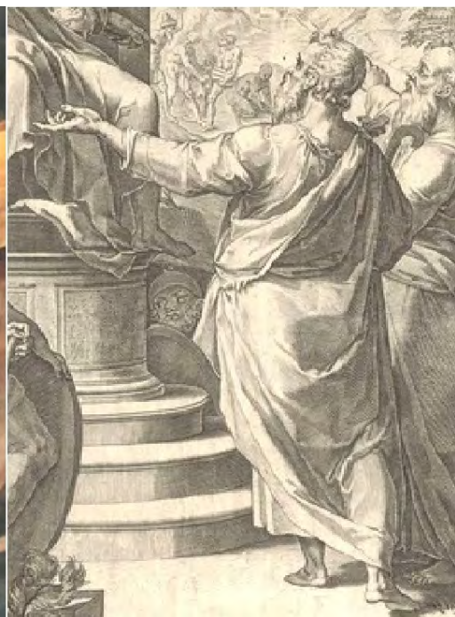
>> Comparativa del quadre de Vicent Salvador Gómez i el gravat de Cornelis Cort.