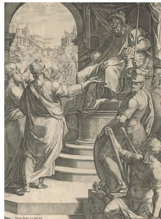
>> Moisés i Aaron davant el faraó, gravat de Cornelis Cort.