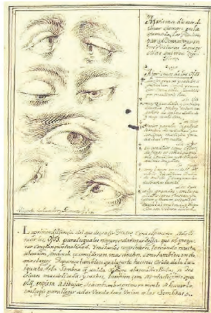
>> Cartilla de dibuix de Vicent Salvador Gómez, manuscrit original.

col·lecció de dibuixos i gravats de qui havia estat el seu mestre, Alonso Cano (1601-1667). Aquest fet va enriquir notablement els coneixements i el repertori iconogràfic de Salvador Gómez, fins al punt que gràcies a això va obtenir un cert avantatge respecte dels seus contemporanis.