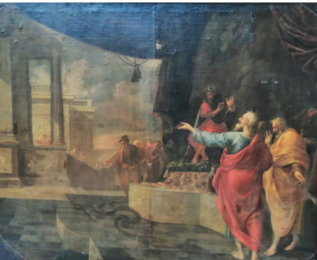
>> Moisés i Aaron davant el faraó, oli sobre tela de Vicent Salvador Gómez.

Text > ELARA PI , historiadora de l'art HANNÍBAL CLIMENT , arquitecte