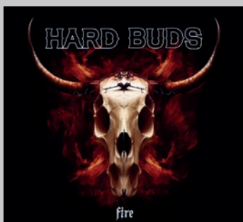
HARD BUDS. Fire . Hard Buds, 2023. < www.hardbuds.rocks >