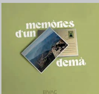
BIVAC. Memòries d'un demà . Bivac, 2023. < www.instagram.com/bivac_oficial >