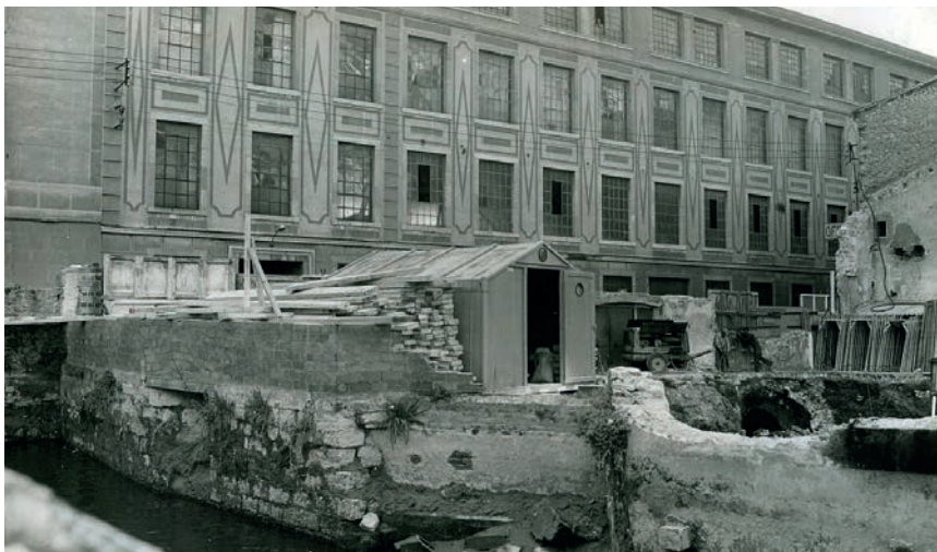
>> La fàbrica de gas Barrau i la séquia Monar.

M'he permès fer aquest excurs sobre la relativitat d'alguns dels personatges que donen nom a carrers i places de la ciutat per fixar-me en un que no tenim ben referenciat en la nostra història urbana. Es tracta del carrer del Perill, al sector del Mercadal. La veritat és que des del segle XI, en tot el traçat de la séquia o el rec Monar, abans de la desembocadura en tres braços de les seves aigües a l'Onyar, a la zona urbana del Mercadal (que històricament ha sofert moltes transformacions desgraciades i irreparables) es documenten molins fariners i drapers que havien