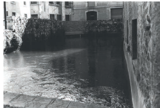
>> La séquia Monar.

Així, a tal d'exemple, tenim que un dels passeigs que fa de rebedor de la ciutat porta el nom de José Canalejas Méndez que va ser un gallec, nascut al Ferrol al 1854, polític liberal que va ostentar els càrrecs de president del Govern espanyol, president del Congrés de Diputats i ocupà també diverses carteres ministerials. Doncs bé, en alguna ocasió he sentit a dir a veus més autoritzades que no pas la meua, que l'actual passeig de Canalejas hauria de ser un d'aquests noms de carrer o passeig que la ciutat s'hauria de plantejar canviar. Doncs bé, de vegades he sentit a dir a veus més autoritzades que no pas la meua que l'actual passeig del General Mendoza hauria de ser un d'aquests noms que la ciutat s'hauria de plantejar canviar. Sabem positivament, pel que fa a aquest passeig, que l'Ajuntament disposa d'un projecte urbanístic per tal de remodelar-lo per complet, un pla que tard o d'hora convindria executar. Quan s'esdevingui l'obra d'aquesta avinguda, des de l'anomenada Copa fins a la plaça de la Independència, convindria també plantejar-se la idea de canviar el nom a aquesta via urbana. Com que l'esmentat passeig ha esdevingut un magnífic