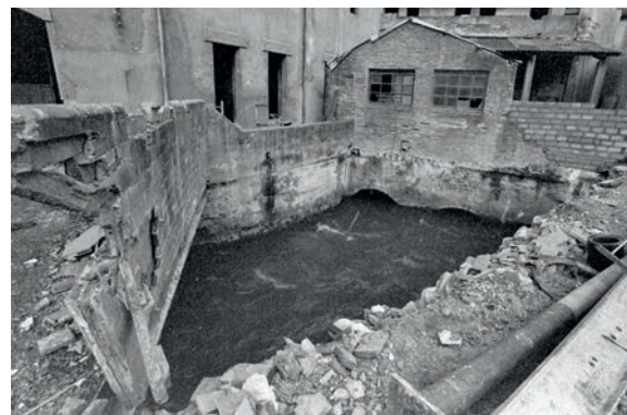
>> Solar de la fàbrica Grober i el rec Monar.

setanta del segle passat, la séquia Monar passava ben descoberta en un bon tram urbà, des de Salt, Santa Eugènia, i entrant a Girona pel carrer de Bernat Boades i pel curs del carrer que duu justament el nom de carrer de la Séquia. En el seu tram final abans d'entrar a la central del Molí (com mostren les fotografies), la séquia traçava una corba o volta certament arriscada perquè el cabal d'aigua baixava fent perillosos remolins i amb molta força. «La calendada azéquia», diu un text del segle XVIII. Fixem-nos que avui el carrer del Perill traça una corba considerable i, a pesar que avui l'esmentada séquia passa coberta, abans en aquest indret passava ben destapada, sense gaire protecció, amb el consegüent perill per a tot ciutadà i, sobretot, la mainada que gosés guaitar pel seu mínim mur de contenció. Com que no hi ha documentació específica medieval ni moderna en aquest sentit que esmenti justament el carrer del Perill o de la Volta del Perill, hauríem de considerar que el nom del carrer es pot atribuir al bateig de la prudent saviesa popular gironina, almenys la del segle dinou.