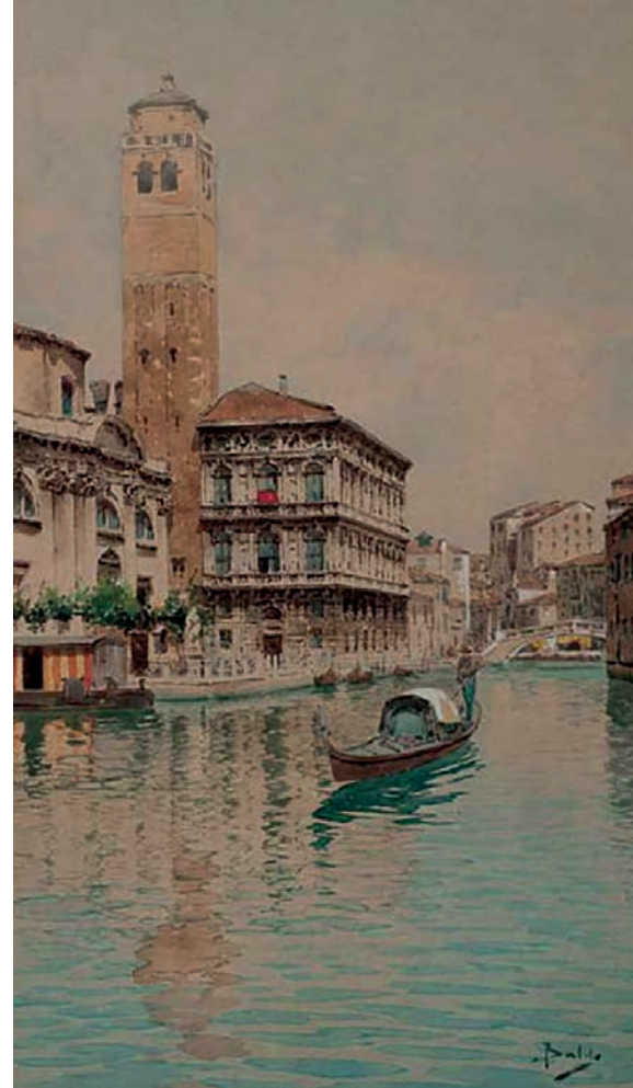
>> Góndola a Venècia, aquarel·la sobre paper (35 x 20 cm).