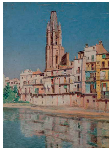
>> Basílica de Sant Feliu des del riu Onyar, oli sobre taula (26 x 18 cm).

Va ser un pintor allunyat de les rutes comercials perquè no tenia necessitat econòmica de rendibilitzar la seva obra, i es va poder dedicar exclusivament a l'art per l'art