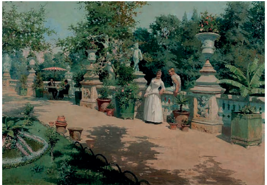
>> Jardins de Luxemburg, oli sobre llenç (78 x 111 cm).