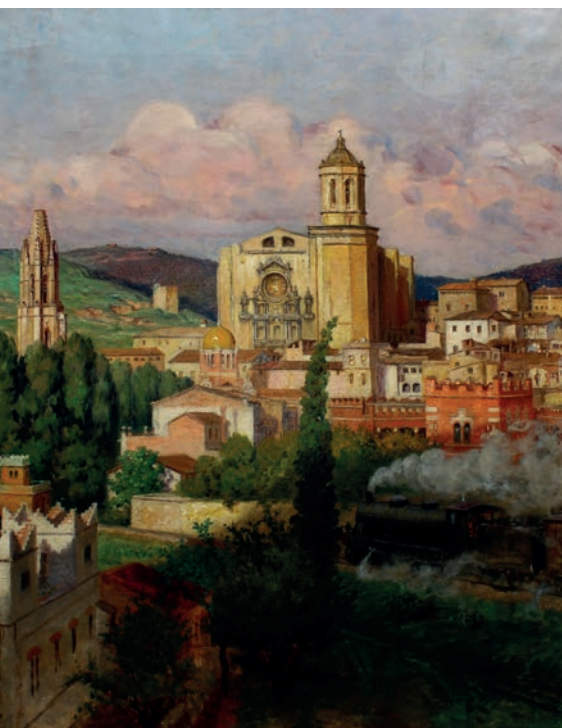
>> El tren passant per Girona, oli sobre llenç (72 x 59 cm).

El 1910, es va tornar a instal·lar a París, on va fer il·lustracions de novel·les per a l'editorial Ernest Flammarion i treballs per a revistes i publicitat, a més de participar en els llibres Mémoires de Poum , L'amour en Italie , Le Fulgur , Bruges-la-morte , Ghislaine , Histoires folâtres , Les Borgia , i altres. Va fer una tasca molt important com a redactor artístic i literari del periòdic bisetmanal Le Bon Journal , de París, durant vint anys.