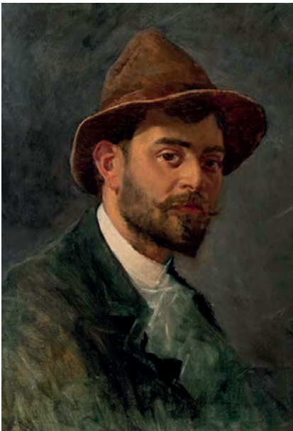
>> Autoretrat de jove, oli sobre llenç (45 x 36 cm).

Entre aquests artistes, un pintor i dibuixant va estar entre nosaltres. Va viure a Girona durant nou anys, hi va pintar i hi va exercir de professor de dibuix de l'Escola Normal de Mestres i de l'Institut de Segon Ensenyament. Malauradament, ha quedat poc rastre