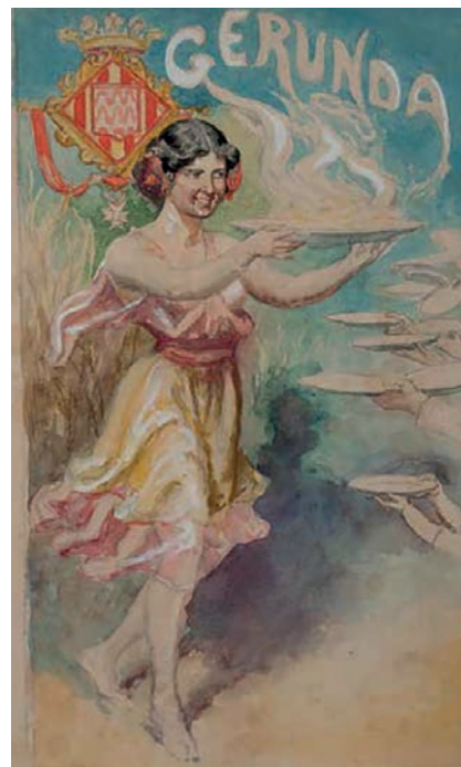
>> Cartell publicitari de sopes Gerunda, aquarel·la sobre paper (31,5 × 18 cm).