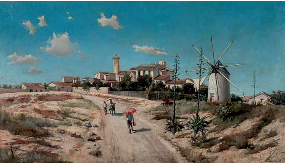
>> Camí de San Pedro del Pinatar, oli sobre llenç (49 x 84 cm).