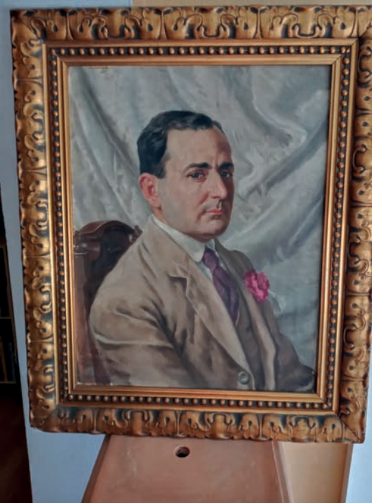
>> Retrat del músic Tomàs Sobrequés i Masbernat, 1918.