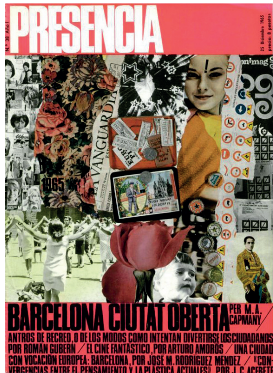
>> Número 38 de Presència, amb nota d'un article de Roman Gubern a la portada que no apareix perquè va ser censurat.

En una reunió clandestina a París van expulsar davant meu una persona perquè havia cantat. La policia espanyola el va torturar i se'n va anar de la boca. Jo em vaig aixecar, vaig dir tot el que pensava i me'n vaig anar. No es pot culpar una víctima de la tortura.