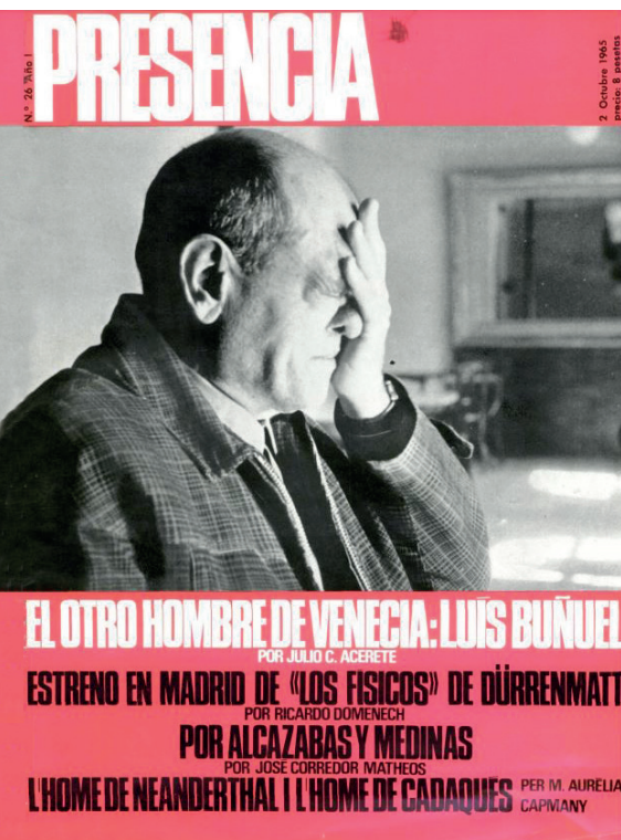
>> Número 26 de Presència, amb el director de Viridiana a la portada.

tar i a fer provatures. A mi per què no em pot abraçar aquesta persona? Crec que la cerca constant de tendresa és el que ha fet sortir els homes i les dones de les seves coves, dels seus armaris i de les seves presons.