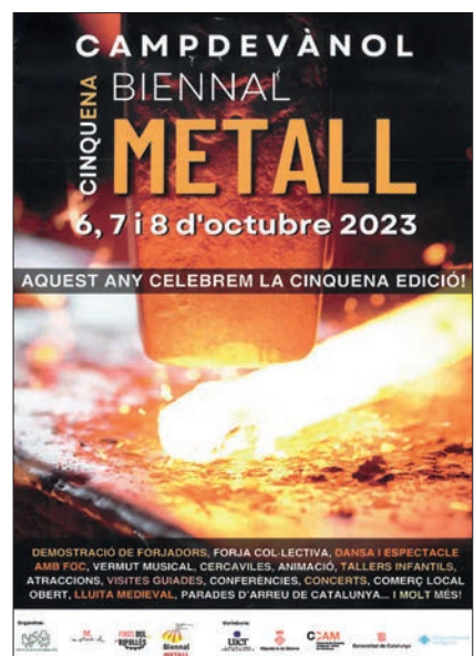
>> Cartell de la Biennial del Metall celebrada a l'octubre a Campdevànol.

A Ripoll, en el marc de la Fira de Santa Teresa, se celebra la Fira Catalana de l'Ovella des de l'any 1843. A Espinavell, el dia de Sant Eduard hi va haver un dels esdeveniments ramaders més esperats per la importància econòmica i turística, la Tria de Mulats. A Sant Pau de Segúries, el primer cap de setmana d'octubre s'organitzà la trobada de ramaders i agricultors que aposten per mecanismes regeneratius; la trobada, titulada Regenerando, va tenir lloc al mas La Sala. I encara una nota històrica referida al bestiar: les darreres recerques i troballes arqueològiques a la vall de Núria i a Ulldeter han posat de manifest que al Ripollès ja hi havia activitat ramadera d'alta muntanya fa més de sis mil anys.