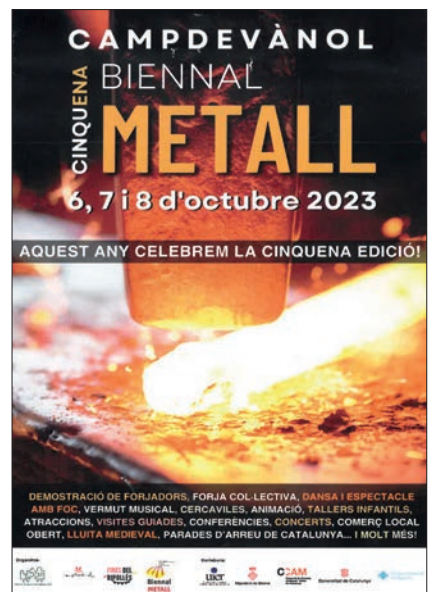
>> Cartell de la Biennial del Metall celebrada a l'octubre a Campdevànol.

A Ripoll, en el marc de la Fira de Santa Teresa, se celebra la Fira Catalana de l'Ovella des de l'any 1843. A Espinavell, el dia de Sant Eduard hi va haver un dels esdeveniments ramaders més esperats per la importància econòmica i turística, la Tria de Mulats. A Sant Pau de Segúries, el primer cap de setmana d'octubre s'organitzà la trobada de ramaders i agricultors que aposten per mecanismes regeneratius; la trobada, titulada Regenerando, va tenir lloc al mas La Sala. I encara una nota històrica referida al bestiar: les darreres recerques i troballes arqueològiques a la vall de Núria i a Ulldeter han posat de manifest que al Ripollès ja hi havia activitat ramadera d'alta muntanya fa més de sis mil anys.