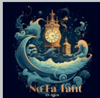
OXIGEN. No fa tant . Oxigen, 2023. < www.instagram.com/oxigenband_ >