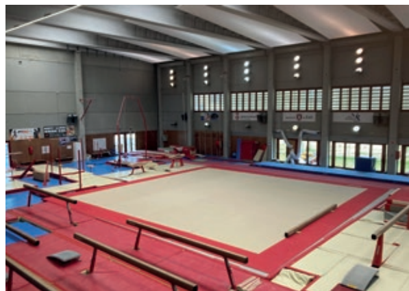
>> Sala d'entrenaments del Salt Gimnàstic Club.