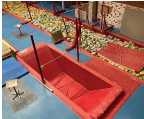
>> La nova fossa, que permet que l'entrenador estigui al mateix nivell que el gimnasta.