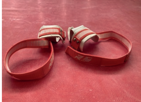
>> Calleres que s'usen per a l'aparell d'asimètriques.