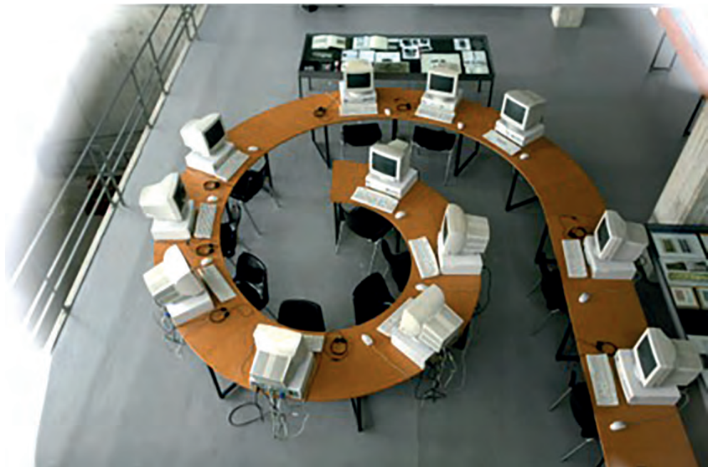
>> Block W. B., Museu de Granollers , 2006.

Podríem enumerar una llarga llista de projectes seus que es mouen entre la instal·lació, l'objecte intervingut, la fotografia, el vídeo i l'edició de textos i de webs. Des de la simplicitat eficaç d' Auschwitz (1997), a la magnífica recerca documental d' El camp de la Bota (2004), la necessitat d'obres com Winnipeg (2005) o el memorial projectat recentment Bosc d'empremtes (2019).