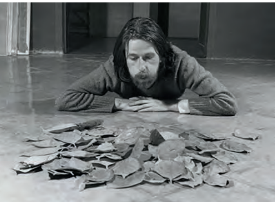
>> Accions: Treball sobre els quatre elements, 1972.