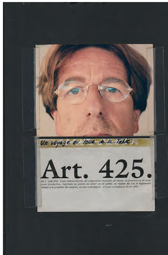
>> Diaris del pensar: Voyage autour de la table, 1998. Pàgina 109 d'un dels diaris, 30 x 20 cm.

Cinc anys després, va portar una barca vella des del port de Barcelona fins a un espai tèxtil abandonat de l'Hospitalet del Llobregat, que amb el temps es va convertir en el Centre d'Art Tecla Sala. És la instal·lació Welfare State o Els herois reals són morts (1987). El tema de fons és el desmantellament del sistema fabril, el fordisme i les economies nacionals, per donar pas a un