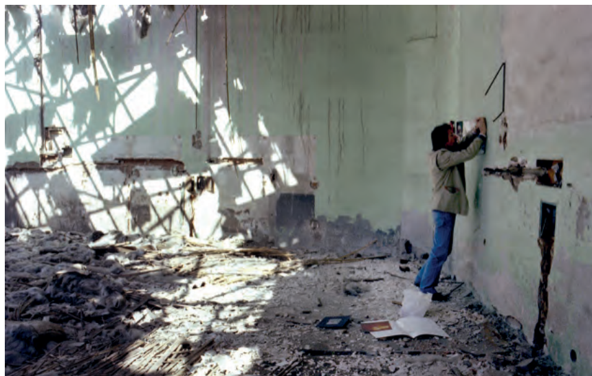
>> Kultur Zivilisation, acció a la fàbrica Terrassa Industrial, 1983.

blanc i negre el mostren bufant terra, fulles i aigua; traçant un quadrat a terra amb una aixada; mesurant distàncies en espais naturals, i provant la resistència i la corporeïtat dels quatre elements. La següent sèrie d'accions mínimes se centra ja en el seu propi cos: comptant i numerant les pigues del braç amb l'ajut del públic, o mostrant el rostre i el darrere del cap amb els cabells eixuts i molls. Una experi-