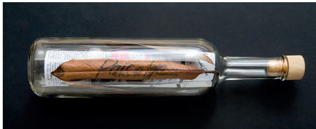
>> Paisatge, 2000.

«El laberint és la pàtria dels qui dubten. L'espiral representa una forma de l'experiència no lineal i oberta que em fascina.»