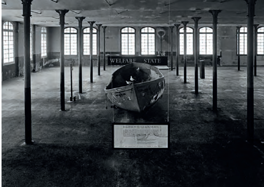
>> Welfare State, Hospitalet Art, 1987.

mentació mínima que encarna la idea d'art com a pur procés.