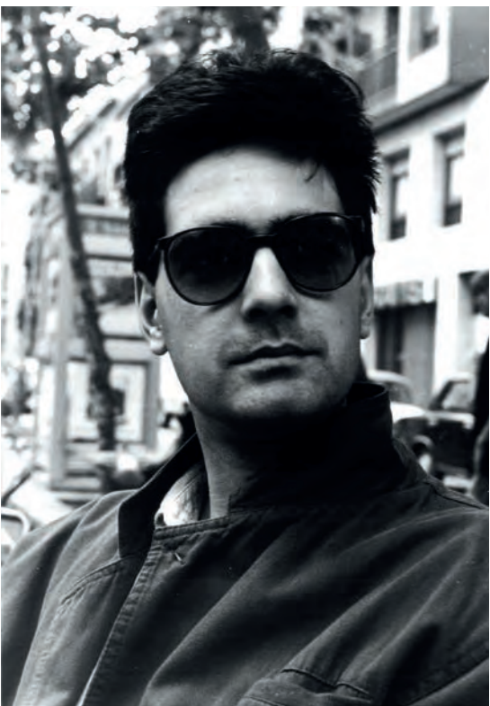
>> L'autor fotografiat al barri de Gràcia de Barcelona, el 1989.

En realitat, els nexes amb tot allò que en Vicenç havia d'escriure ja arrenquen amb el cutiflinxs del títol, una paraula extreta de l'argot que fan servir els personatges. El seu significat (noia atractiva) l'acabarem descobrint gràcies a una nota a peu de pàgina d' El món d'Horaci . Igual que ens passarà amb els termes butiflai (noia tibada, creguda) o txinorris (petits, petites)... L'ús d'aquests idioletes, per cert, lliga amb l'època en què va començar a fer de crític literari, en què solia queixar-se de la poca credibilitat que trobava en els diàlegs juvenils de molts novel·listes del país. Davant d'aquest català encatronat, va proposar un model alternatiu de llengua literària molt proper a l'oralitat, empeltat de variants empordaneses, neologismes i anglicismes, ple de mots hermètics, argot dels comix