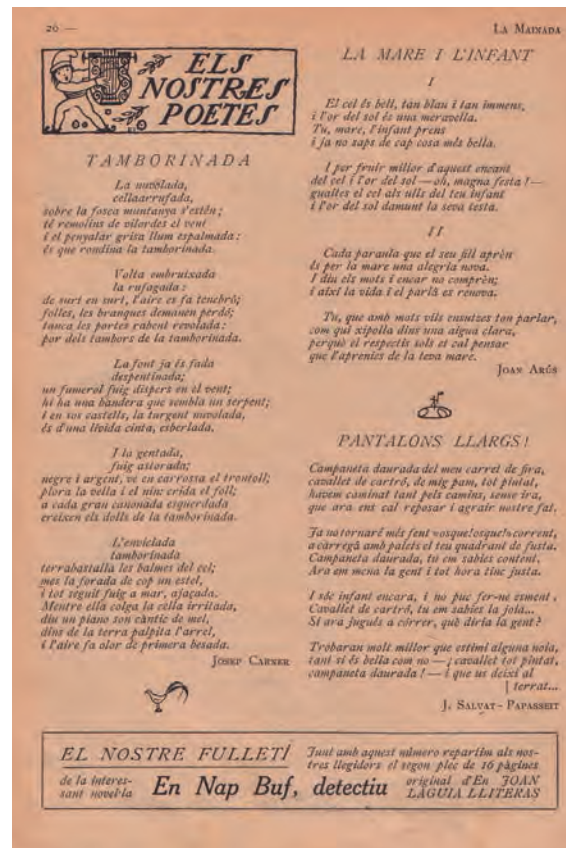
>> Poemes de Carner i Salvat-Papasseit publicats a La Mainada .

Els concursos són considerats seccions importants de la revista, ja que en mostren l'acceptació entre els lectors i són una font de fidelització. Al núme-