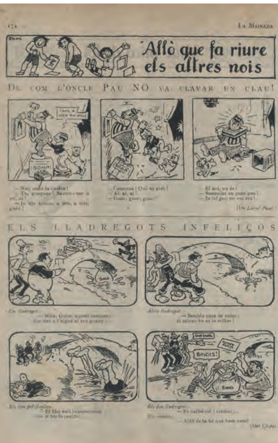
>> Una pàgina d'una secció molt original: humor internacional.