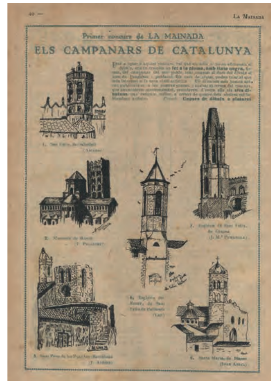
>> Una pàgina de campanars gairebé gironina al cent per cent.