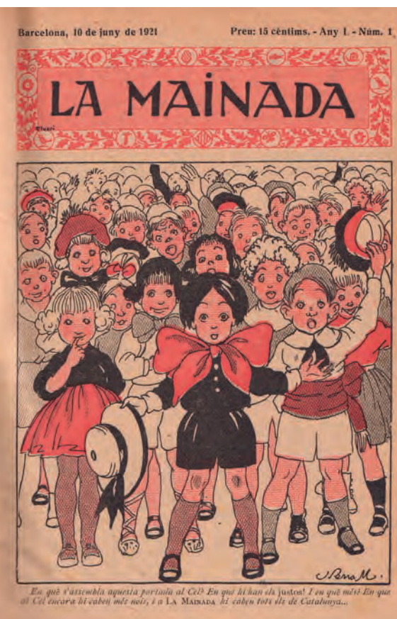
>> Portada del número 1 de la revista.

23, 11-11-1921). Al Calendari de 1923, hi va publicar dues suposades cartes entre dos enamorats, en Lluís i la Mari-Àngela (p. 184-185).