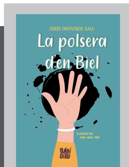
ONTIVEROS SALA, Jordi. La polsera d'en Biel . Sevilla: Babidi-Bú Libros, 2022. 68 p.

en el qual sobreviu amb tota mena de feines i sense ningú en qui poder confiar durant quatre anys: «El món és massa gran per a una dona sola!». La Soledad, honorant un nom que molt probablement no és casual, aprèn finalment que, a l'estrangera terra suïssa, només es té a si mateixa, i Bertrana aconsegueix fer allò que sabia fer més bé: entendre la literatura des de l'experiència i donar-nos en aquesta seva darrera obra un retrat vivencial del seu propi exili.