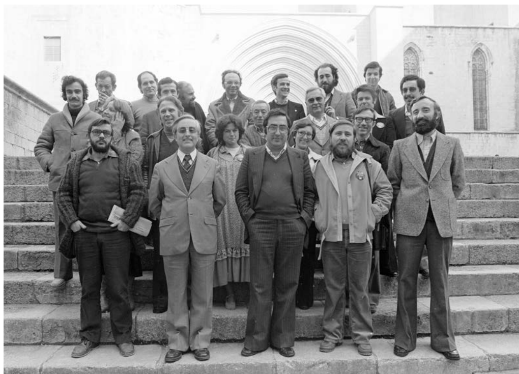
>> Candidatura del PSC a les primeres eleccions municipals democràtiques.

zació i no sabien com fer-ho. Ràpidament, un grup de mestres d'adults de Salt i Girona hi van respondre positivament, i van elaborar un projecte que es va fer realitat en l'Escola Africana d'Adults Samba Kubally, una experiència absolutament inèdita a Catalunya, i que va merèixer el reconeixement públic quan va rebre, l'any 1991, el Premi Miguel Hernández. De fet, els darrers anys del segle passat es va començar a viure a Catalunya l'arribada intensa i extensa de molts immigrants procedents de l'Àfrica subsahariana i