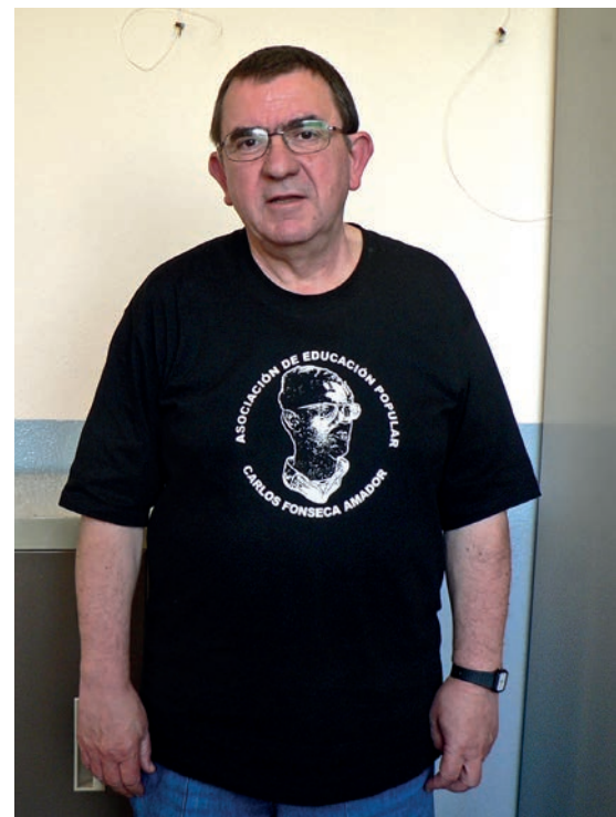
>> Amb la samarreta de l'AEPFCFA.