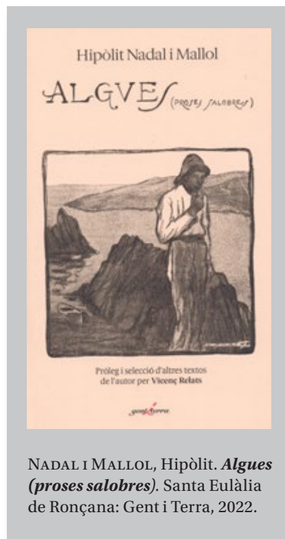
NADAL I MALLOL, Hipòlit. Algues (proses salobres) . Santa Eulària de Ronçana: Gent i Terra, 2022.

Plena de referències a elements de la cultura popular, una trama amb sexe, drogues i armes (en lloc de l'incombustible rock-and-roll ), i salpebrada amb lleugers tocs d'un histrionisme que recorda el del cineasta nord-americà Quentin Tarantino, El nen que volia ser assassí et manté atent fins a la darrera pàgina i no deixa mai de sorprendre, tant com el títol mateix, un bon esquer perquè piquem l'ham.