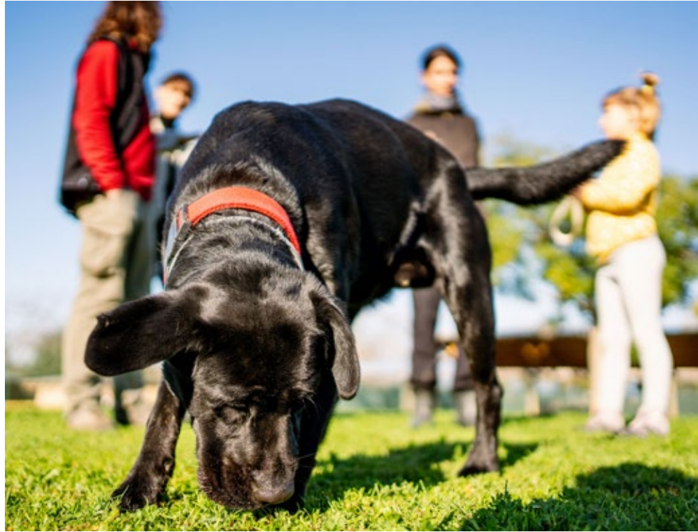
>> Educadors i unes visitants amb el seu gos a la residència Canisapiens.