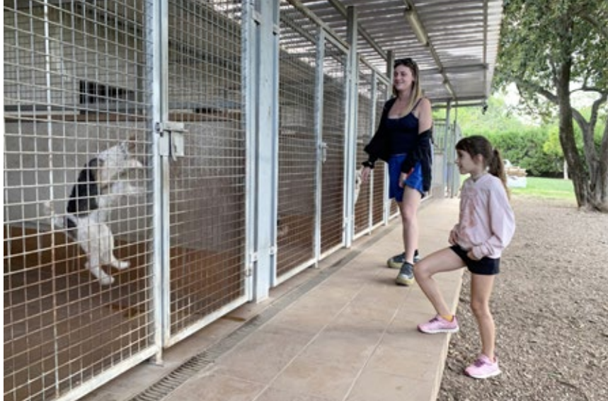
>> Unes visitants a les instal·lacions de la residència canina Campdorà.