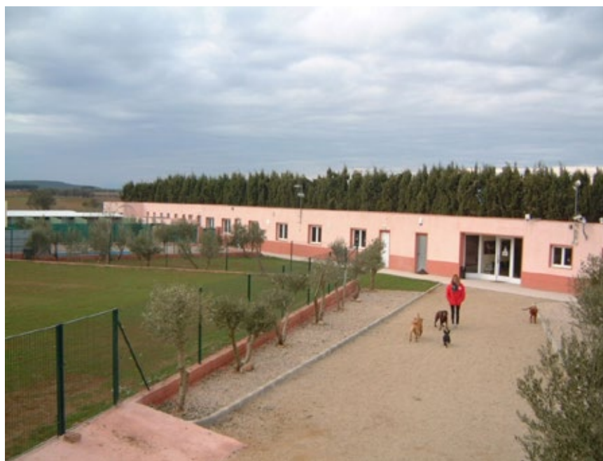
>> Imatge exterior de la residència canina Mascotes Costa Brava.