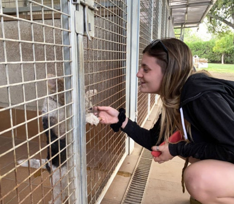
>> Una usuària visita les instal·lacions de la residència canina Campdorà.

admet Gras. A la residència canina Mascotes Costa Brava, concretament, el nombre d'estades ha crescut un 56 % entre 2019 i 2022. També hi han augmentat les vendes de cadells: el 2019, en van vendre 411, mentre que el 2021, van pujar a 503. Això suposa un creixement del 22 %. Aquest any, a més, ja s'han superat les estades de l'any passat i la projecció és arribar a les sis-centes, segons informen des del centre. És una residència tant canina com felina, que, segons explica el gerent, Joan Esquiva, disposa de veterinari, botiga de complementos i clínica veterinària, a més d'un circuit d'agilitat canina i ensinistrament. «Som dels pocs que tenim una gran piscina. Té una entrada progressiva i no cobreix. A l'estiu, els cànids en gaudeixen molt», ressalta. Pel que fa a la residència felina, es tracta, en el seu cas, d'una habitació tancada amb una sortida a un pati exterior.