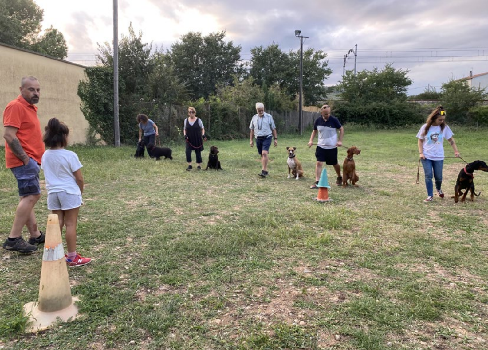
>> Un educador caní fent sessions a la residència canina Campdorà a un grup de responsables i cànids.