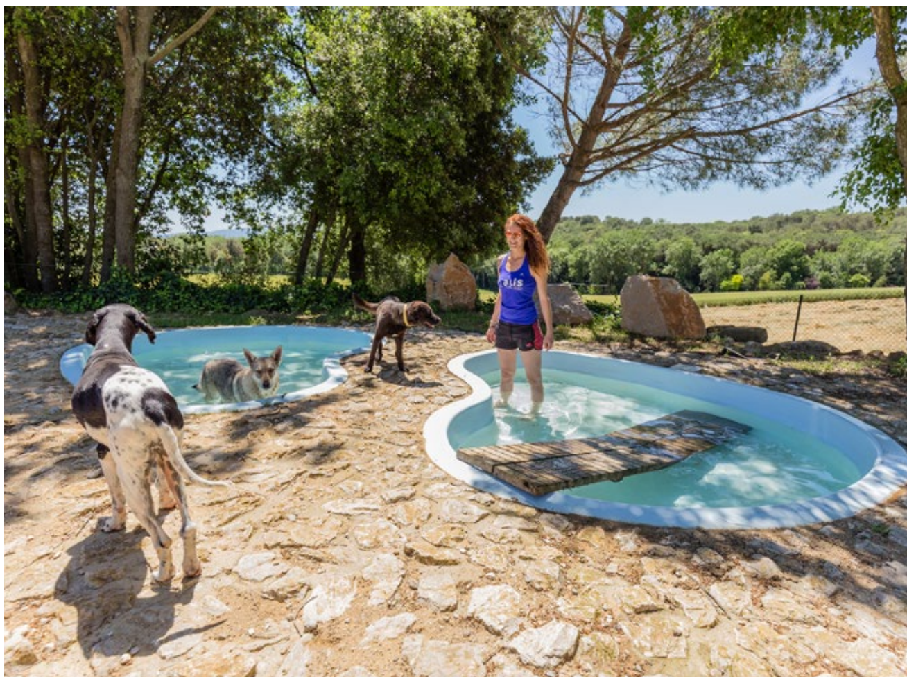
>> Les piscines on poden jugar i refrescar-se els gossos a la residència canina Alis Animal Resort.

que fan ús de les instal·lacions també ha augmentat. Els equipaments presenten formats nous: n'hi ha sense gàbies i estan en auge els professionals que van a casa a cuidar l'animal, una opció que permet que el gos o el