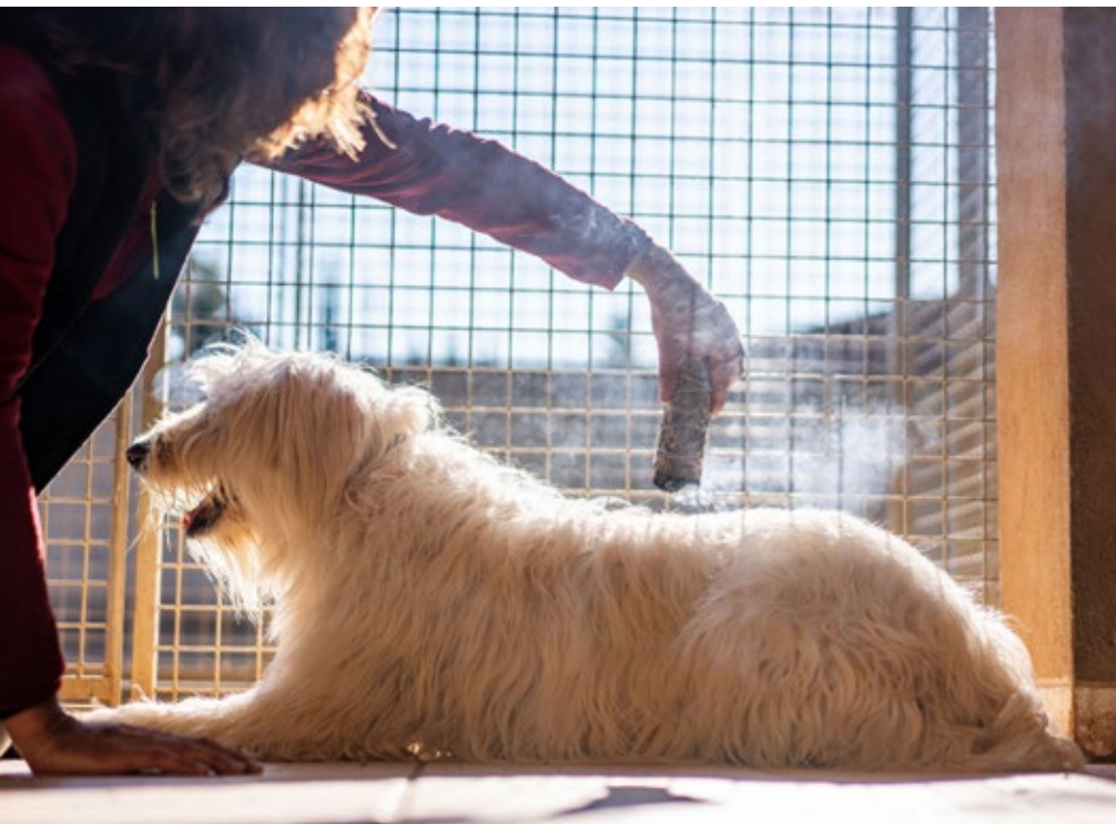
>> Un educador caní de la residència Canisapiens fa un bany de sàlvia a un gos.