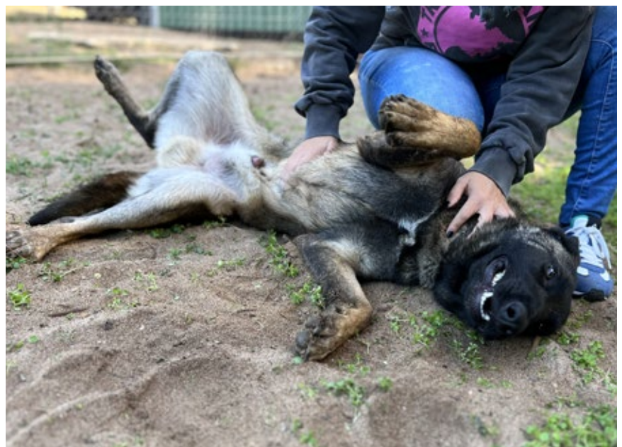
>> En Rex, un altre dels gossos rescatats per l'Anxova Peluda.