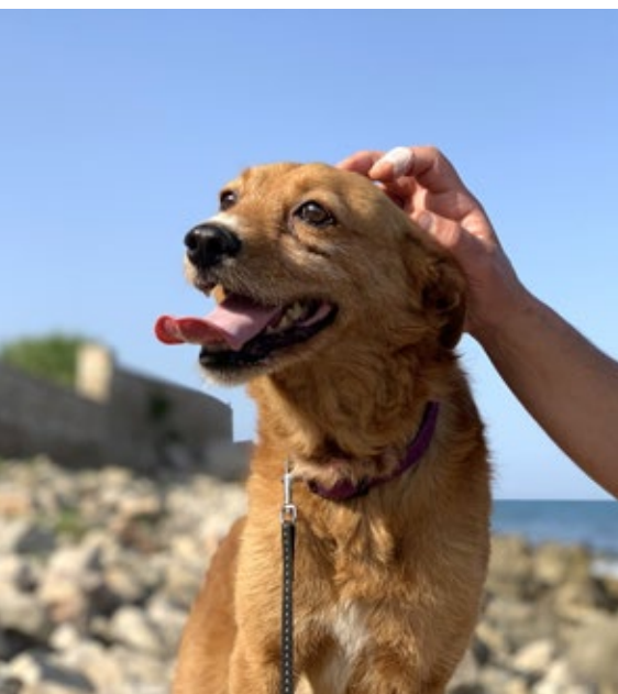
>> En Sam, un dels darrers gossos rescatats per l'associació L'Anxova Peluda.