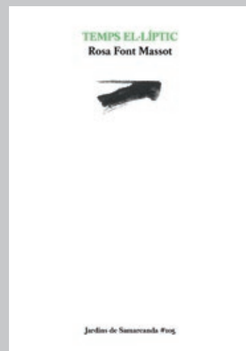
FONT, ROSA. Temps el·líptic . Barcelona: Eumo Editorial, 2022. 64 p.

«Al cap i a la fi, la bellesa no és sinó en l'ull que mira», diu el vers de Guyau que Manolita envia a Rahola. I l'ull de