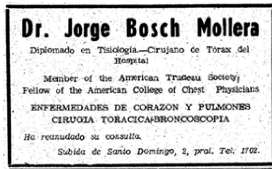
>> Anunci professional a la premsa de l'època.