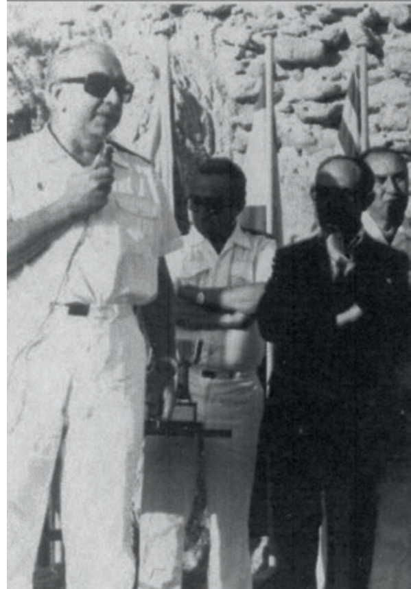
>> Parlant com a director de la Creu Roja del Mar.

Aquells anys, el tisiòleg gironí va fundar la Lliga Naval a Girona, de la qual va ser president el 1975, i va entrar a formar part de la Junta Directiva del Club Nàutic Costa Brava (CNCB). Atesa la gran quantitat de gent que se'ls adreçava per demanar informació sobre què calia fer per conduir diferents embarcacions, a iniciativa del doctor