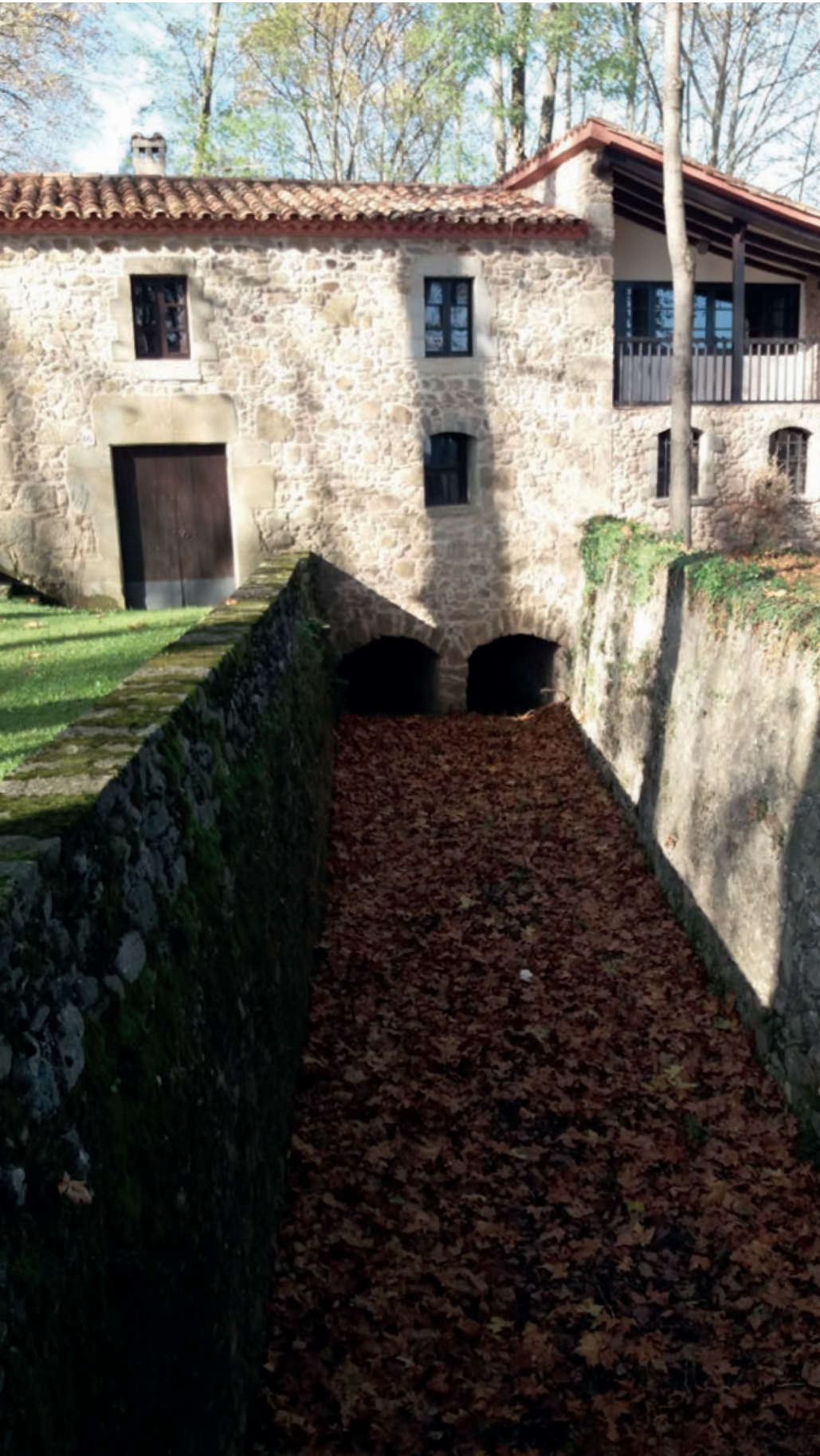
>> Molí de Massegur, un molí del segle XVII, amb la sortida d'aigua dels dos carcabans i de dimensions considerables.

cobraments senyorials. Allò que ens intriga és que no tenim constància que hi hagués grans conflictes jurídics (no se n'ha conservat documentació o no se'n va fer l'acció notarial aleshores) entre senyors i pagesos per l'ús d'aquests molins en règim de monopoli. L'existència, doncs, d'aquest elevat nombre de molins privats qüestiona bona part del monopoli feudal, de manera que, o bé hi ha un reforç dels mecanismes de defensa i autodefinició dels pagesos (potser derivats de les lluites pageses dels segles XIV i XV: masos ròncecs, remences, etc.), o bé un afèbliment progressiu del poder d'una noblesa acostumada a viure de les rendes imposades a la pagesia, i que entra en crisi des de final del segle XVIII, confirmada a partir de l'abolició dels drets senyorials després de les Corts del 1812. No sabem fins a quin punt hi afecta, de forma positiva, aquesta decisió, però el que sí que sabem és que hi va haver un màxim de quaranta-tres molins a la vall. En tot cas, sí que tenim constància de la gran activitat constructiva i de reparació o ampliació d'alguns dels molins ja existents.