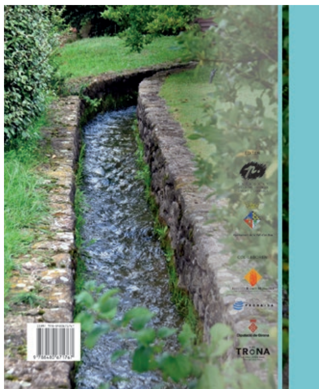
>> Cobertes anterior i posterior del llibre La cultura de l'aigua a la Vall d'en Bas.

plicat, però combinats amb l'esforç i el treball seculars, i que va donar com a resultat aquest patrimoni que ara analitzem.