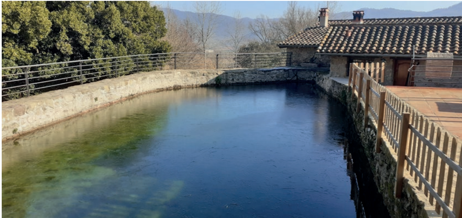
>> Bassa del molí del Perer, de dimensions mitjanes. La paret que està en contacte amb l'edifici, allà on se situa el cub, té aproximadament uns dos metres de gruix, per poder contenir la pressió de l'aigua.

manera que havien de produir tot allò que havien de menester per garantir-la. I no només produir-ho, sinó elaborar-ho i transformar-ho en béns de consum. Allà on l'activitat era bàsicament agrària s'instal·laven molins per obtenir la farina per elaborar pa. Per les dimensions d'alguns d'aquests molins, realment petits, entenem que eren de producció limitada al consum familiar i poca cosa més. Poques vegades els molins eren grossos, i en aquests casos, responien a una àrea d'influència important (molí de Massegur i molí de Valentí, a Sant Privat). Així, veiem que els moliners eren, majoritàriament, pagesos a temps parcial que dedicaven una part del seu treball a la molinaria i al manteniment i la reparació del molí, especialment a l'hivern, quan no hi havia feina al camp ni gaire aigua, i era més fàcil netejar els recs, els canals i les basses, i reparar les peces de fusta i metàl·liques que calgués. Totes i cadascuna d'aquestes feines quedaven contingudes en els contractes d'establiment i afermament que hem pogut consultar, que corresponen a la notaria del Mallol, i que estan dipositats a l'Arxiu Comarcal de la Garrotxa.