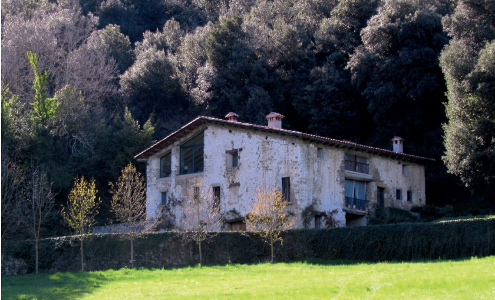
>> Molí de la Lloatera, del segle XVIII.