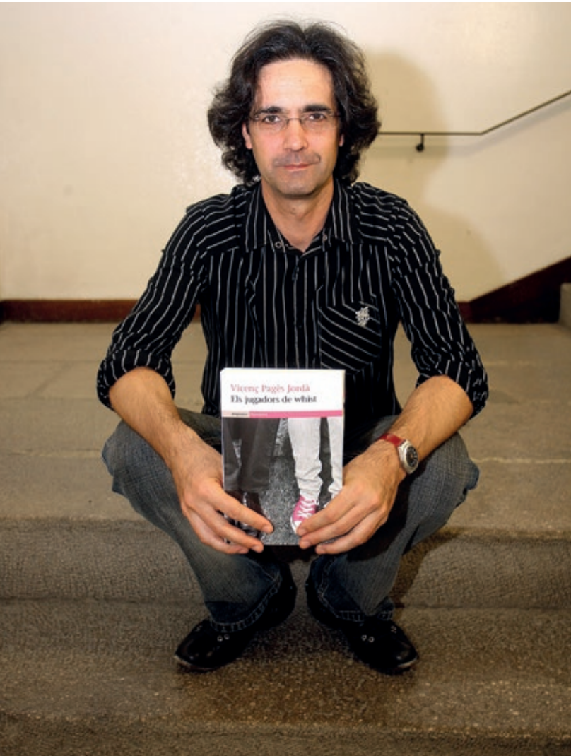
>> Pagès mostra una de les seves novel·les més conegudes.