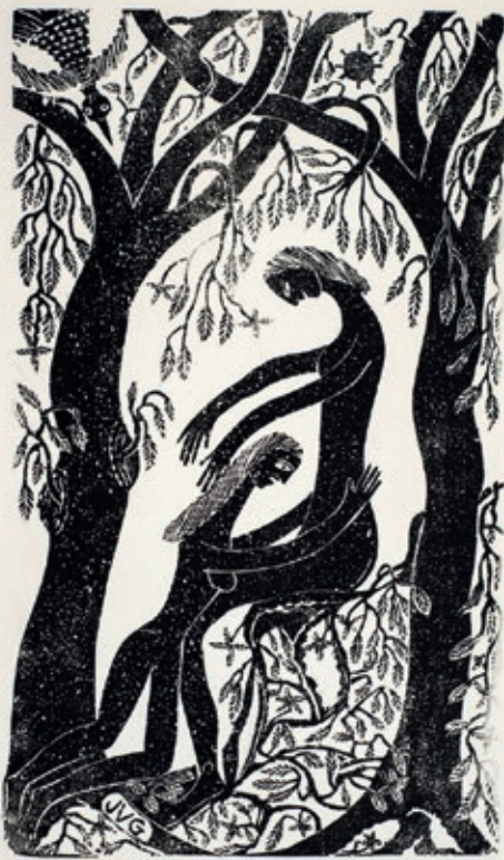
>> El perdó, s. d.

tística. Era una mena de nou romanticisme que, com la paraula viva de Joan Maragall, aspirava a una expressió lliure que brollés espontàniament de les fondàries de l'ésser sense veure's condicionada per factors culturals i mercantils. Això el va portar a interessar-se per la producció dels alienats i els aïllats socialment, els excèntrics i els inadaptats, els autodidactes i les persones foranes o rebels a la cultura instituïda. Entre els seus objectius hi havia la voluntat de subvertir els gustos artístics i l'ordre sociocultural establert, així com el model civilitzador en què se sustentaven.