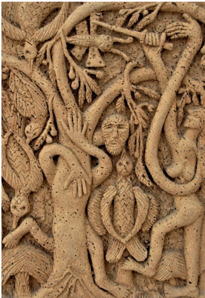
>> Els caçadors de papallones, s. d.

Diverses peces de Vicens van passar a formar part de la col·lecció de Dubuffet, la qual cosa va ser decisiva per a la projecció pública de la seva obra