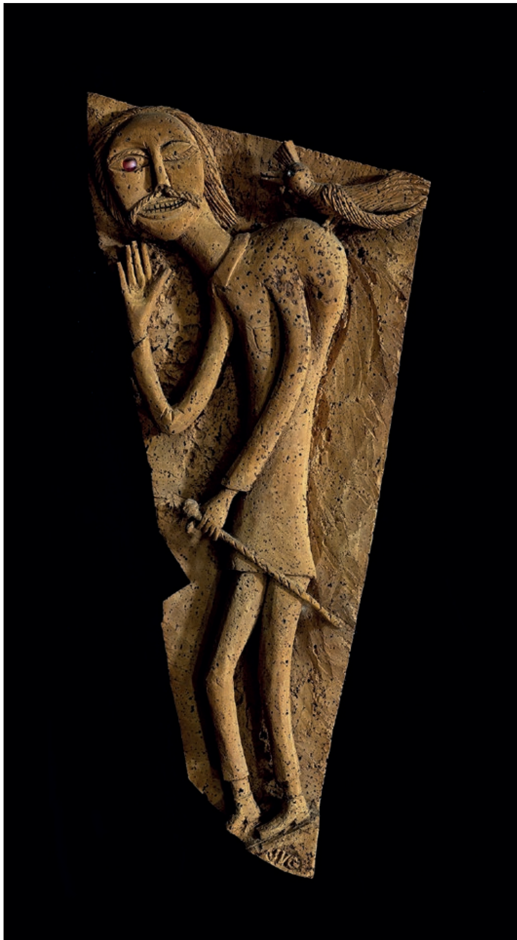
>> El geperut, s. d.

Retornat a Tolosa, va dirigir la revista Catalunya , patrocinada per sectors de l'exili i la resistència antifeixista. Posteriorment, desenganyat de la política, va practicar un original treball escultòric