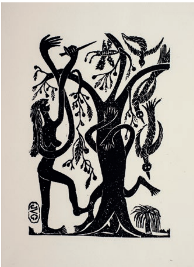
>> L'assassinat de les papallones, s. d.