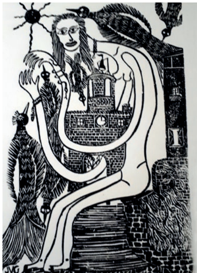
>> Sense títol, s. d.