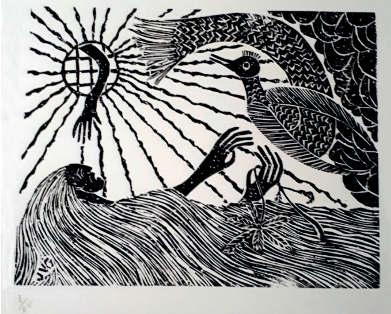
>> La deriva, s. d.