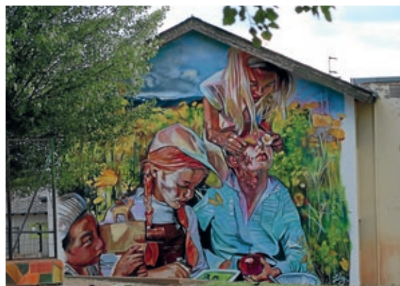
>> Mural de Lily Brick per a l'escola Bac de Cerdanya, a Alp.

La pintura, feta amb esprai, ocupa una de les parets laterals de l'edifici, i s'estima que durarà uns deu anys. A més, tindrà un impacte incalculable en els alumnes cerdans que han pogut veure com Lily Brick treballa en directe. L'artista és reconeguda internacionalment, i ha pintat murals arreu del món: de l'Agència Espacial Europea a Reus; de Bombai a Alp.