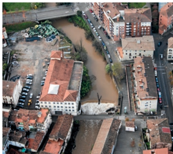
>> Vista aèria del riu Fluvià, el pont de Santa Magdalena i el carrer de Sant Cristòfol, amb un solar on es projecten habitatges públics.

Promoció d'habitatge públic | La construcció d'habitatge públic és una preocupació arreu del país, i diferents ajuntaments procuren posar-hi remei, encara que portar-ho a la pràctica resulti d'una lentitud desesperant. A Olot s'ha aprovat provisionalment la modificació puntual del Pla d'Ordenació Urbanística Municipal del carrer Sant Cristòfol i el pont de Santa Magdalena per encarar la nova promoció. Es considera un pas important per a la construcció de 87 nous pisos socials, una de les inversions rellevants del pressupost de l'Ajuntament d'Olot per al 2022. La modificació puntual per al