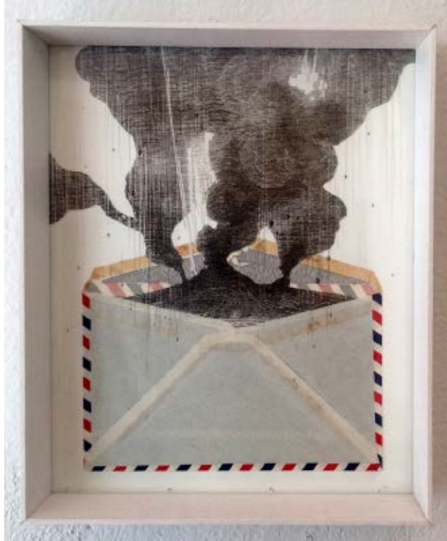
>> Correspondències, 2015.