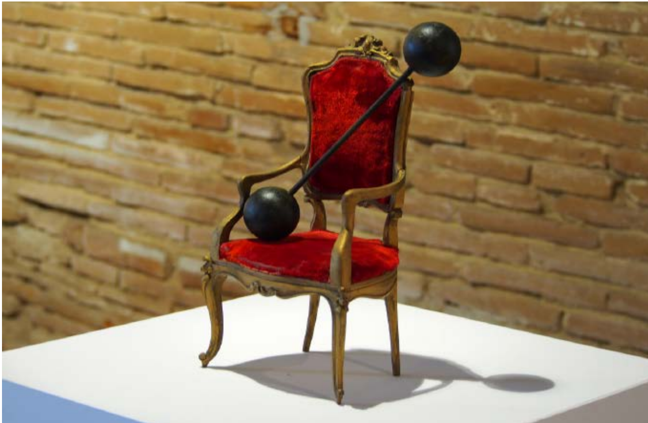
>> El novio de la mujer barbuda, 2016.

gonisme. D'altres, com algunes tecles, havien estat acolorides i reconfigurades en composicions que remetien a la idea de teclat. Tot i que no s'hi sentia cap so, la descomposició d'un objecte tan connotat com un piano atorgava a