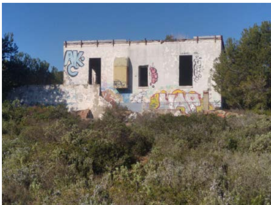
>> Un dels edificis de la base Loran, avui.