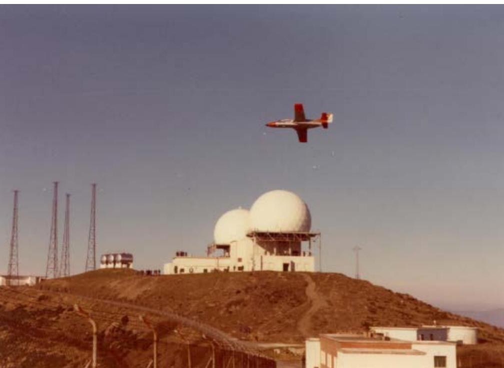
>> Imatge històrica de la base del Pení de Roses.

Contra aquest fet, l'Ajuntament de Torroella interposà un recurs contenciós administratiu que va ser desestimat. Els problemes no s'acabaren aquí. El 2 de juliol de 1962, el consistori va rebre una altra notificació del Sector Naval que l'informava d'una im-