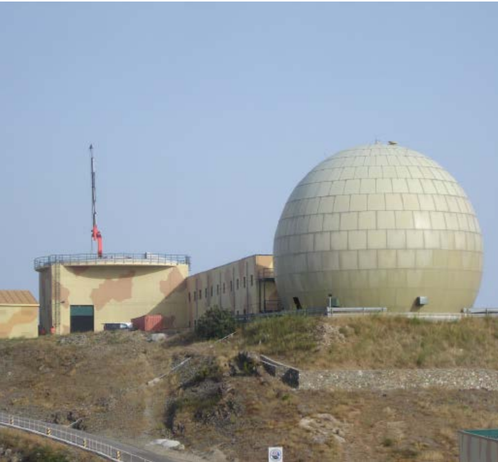
>> Imatge actual de la base.