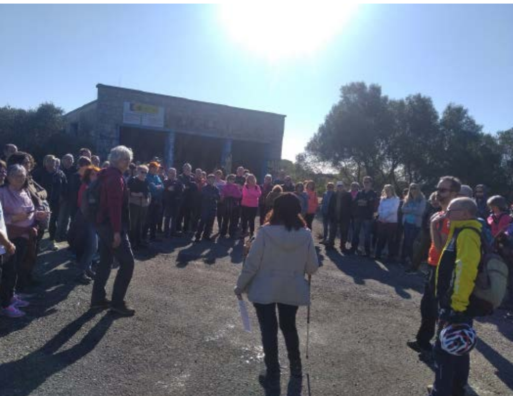
>> Visita a les instal·lacions de la base Loran organitzada per Gent del Ter.

La base situada entre Cadaqués i Roses, amb l'Esquadró de Vigilància Aèria número 4 (EVA 4), forma part de la xarxa de l'Estat espanyol, que al seu torn està integrat en el sistema de defensa de l'OTAN. La seva funció principal és obtenir, processar i transmetre dades de radar. La base es va inaugurar l'any 1959, dependent de la 65a Divisió de la Força Aèria dels Estats Units d'Amèrica (USAF), com a base conjunta entre Espanya i els Estats Units.