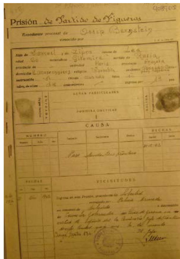
>> Expedient d'Ossip Bernstein a la presó del partit judicial de Figueres.