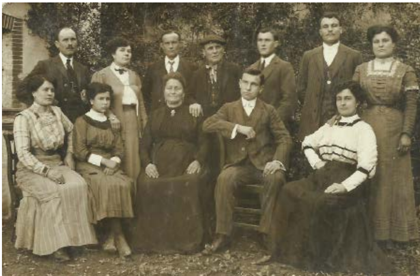
>> La família de Can Quintana de Palau-sacosta.

d'una fotografia. A vegades hi posava títol i tot, i algun cop les signava. Al revers d'una de les fotografies hi diu, per exemple: «Lliurona, a través d'una sitja fumejant». També va fer fotografies més d'estudi, individuals. Recordem un autoretrat seu, amb vint-