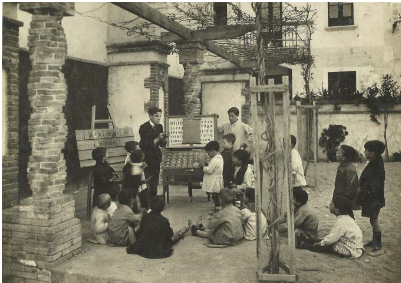
>> L'ensenyament dels pàrvuls a les Escoles Parroquials (1921).