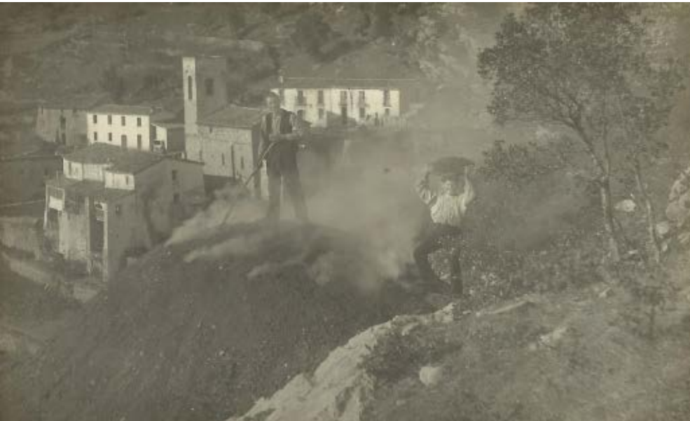
>> Lliurona, a través d'una sitja fumejant (1915).