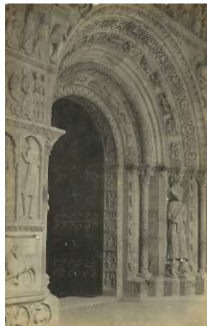
>> Fotografia de la portalada del monestir de Ripoll, feta en tornar d'una excursió a Núria, potser amb Fagnoli (1912).

>> Mossèn Pere Torrent, un sacerdot de vint-i-set anys a la Lliurona de 1915.