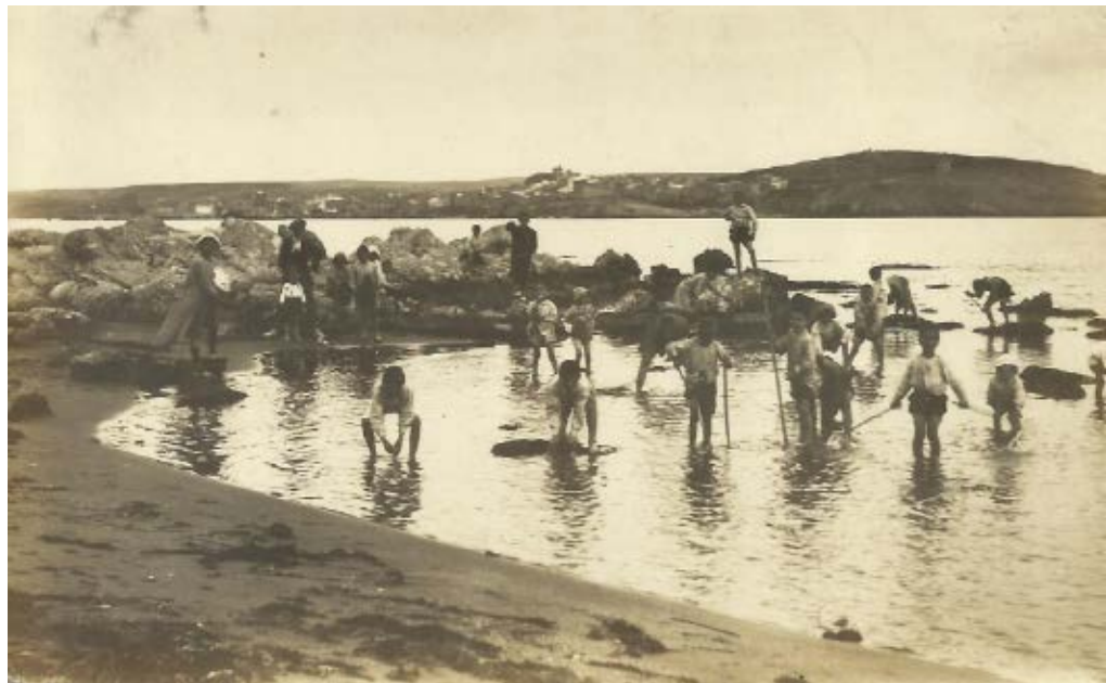
>> L'Escala des d'Empúries.

lentí Fargnoli, el qual li va fomentar l'afició per captar imatges i paisatges. No solament el va ensinistrar en el domini de la màquina de retratar i en l'ús dels mecanismes, productes i processos que calia seguir per captar, revelar i obtenir les fotografies que es volien, sinó que, com els pintors quan descobrien el plein air , li va ensenyar a sortir a l'exterior, a buscar motius i detalls interessants, a descobrir elements artístics, a jugar amb la llum i els contrastos, a retratar persones i grups, a perpetuar monuments i racons bonics... Valentí Fargnoli i mossèn Torrent van ser bons amics, van fer algunes excursions junts i van tenir una autèntica relació de mestre i deixeble. Normalment, el vehicle que feien servir per a les seves escapades fora de Girona era la bicicleta, un altre d'aquests elements relativament innovadors que plaïen al sacerdot i que també devia satisfer el seu mestre. El desplegament artístic del deixeble es va veure afavorit per les destinacions que va tenir com a sacerdot. A Lliurona, el primer lloc on va anar de vicari, va trobar un paisatge que li brindava espais, racons i escenes immillorables. Les muntanyes pirinenques li oferiren el seu encant i el seu tipisme, i mossèn Torrent va saber captar, de seguida, la vida rural, de la gent del camp i del bosc, dels carboners que treballaven a les piles de llenya fumant per convertir-les en carbó... D'aquests temes n'hi hem trobat més