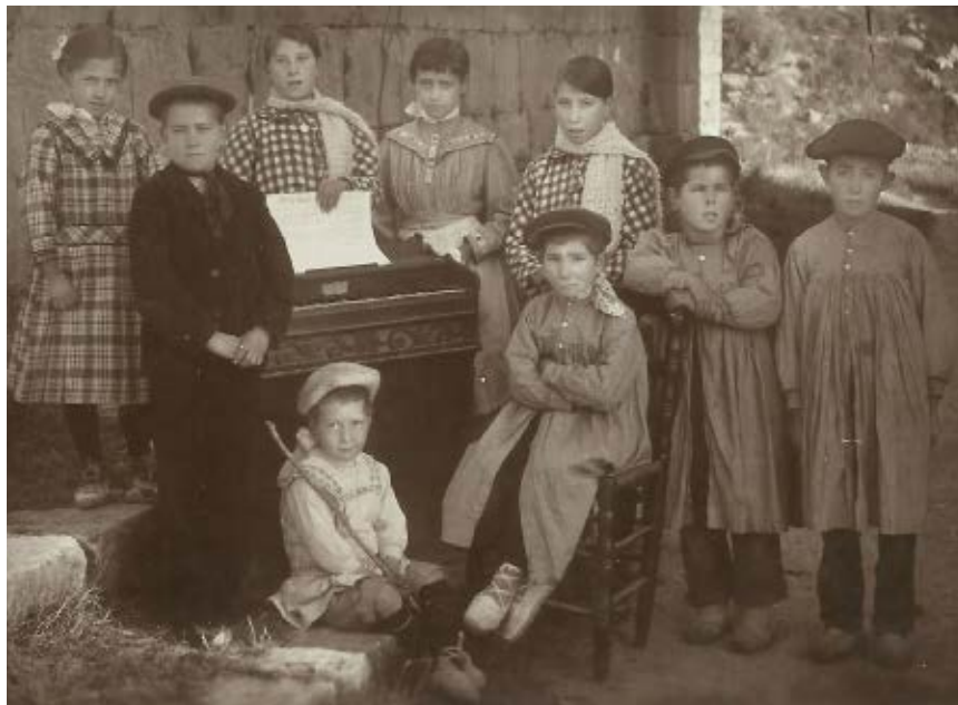
>> La Capella Sixtina de Lliurona (1915).