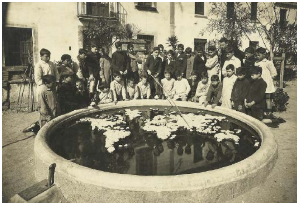
>> Classe de geografia a les Escoles Parroquials (1921).

porada també hi havíem tingut la classe, perquè era més assolellada) o continuar endavant i entrar a la sala que servia de col·legi i que, a través d'una porta balconera, es comunicava amb un hort que feia de pati d'esbarjo. Dins l'aula, a mà esquerra, hi havia una porta que donava pas al despatx del mossèn i que, alhora, li servia d'estudi i laboratori fotogràfic. Allà tenia tots els estris i materials: la pica per revelar, les màquines, els productes químics, algunes capsas amb plaques de vidre, l'amplificadora, el paper per positivar, etc. De vegades calia fer alguna fotografia de carnet urgent i deixava momentàniament els alumnes, que continuàvem fent feina pel nostre compte, i feia l'encàrrec.