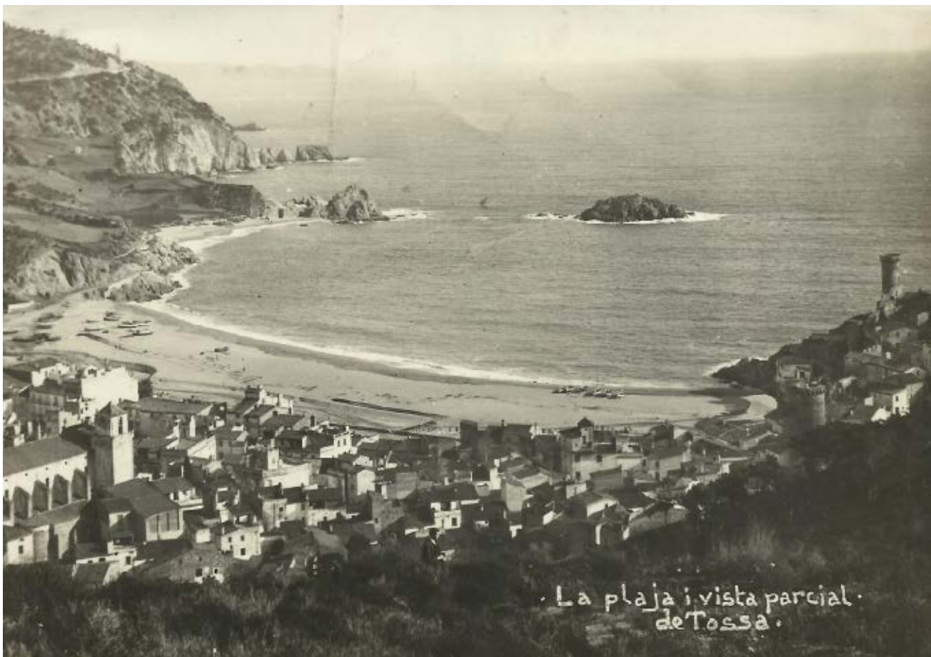
>> La platja i una part de la població de Tossa (1921).